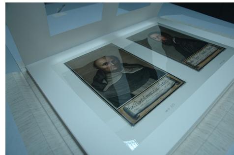
Slika 7 Oprema umjetnina na papiru