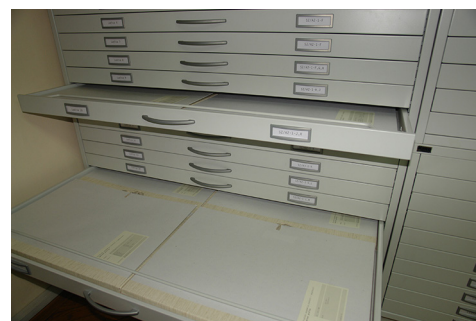
Slika 8 Ladičari za pohranu građe u Kabinetu grafike HAZU