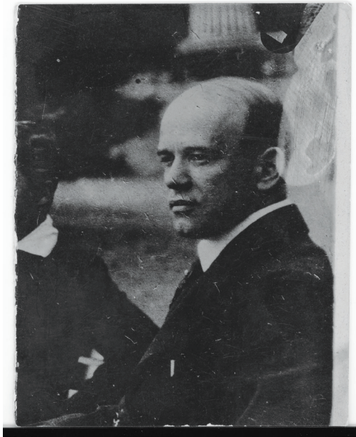
Slika 1 Dušan Plavšić

u formiranju mladog intelektualca. U Beču se uključuje u rad Hrvatskog akademičkog društva Zvonimir, koje je bilo nositelj studentskog pokreta izvan Hrvatske, a u čijim Pravilima stoji da je osnovano „s ciljem duševne naobrazbe i društvene zabave svojih članova, te da se svaka politika isključuje”. Pravi članovi mogu biti samo „hrvatski đaci bečkih visokih škola” i „mogu biti članovi sve dok ne polože svoje ispite”. 6 Hrvatskih je sveučilištaraca u Beču u posljednjem desetljeću 19. stoljeća bilo dovoljno za stvaranje kritične skupine koja je nastojala priključiti hrvatsku kulturu modernim zbivanjima i postati jednim od ključnih čimbenika razvoja hrvatske moderne umjetnosti i književnosti. Uz Plavšića, u Beču su u to vrijeme Ivo Pilar, Milivoj Dežman i Iso Velikanović te Robert Frangeš, Rudolf Vadlec, Tomislav Krizman i Ivan Meštrović.