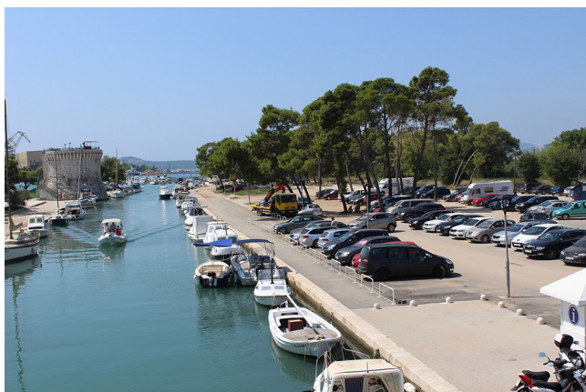
Slika 7 Ambijent pred ulazom u povijesnu jezgru grada Trogira