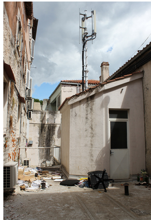
Slika 1 Primjer devastacije: betonska terasa nad dvorištem

Devastacije, bespravne gradnje, odnosno nelegalne građevinske intervencije u povijesnoj jezgri Trogira još nagrđuju i uništavaju grad kao jedinstvenu cjelinu. Sveudilj i naveliko gradi se bez dozvole; dižu se čitavi katovi od bloketa ili pak od betona. Uništava se krovni pokrov od kupa kanalice na mnogim kućama i zamjenjuje betonskim terasama (sl. 1, 2, 2a, 3). Probijaju se mnogobrojni otvori za prozore i vrata, i to bez kamenih okvira. Drvene vratnice i prozori mijenjaju se onima od plastike i aluminijskim (sl. 4). Uništava se i pločnik. Onaj pred sjevernim gradskim vratima, uz blagoslov konzervatora, zamijenjen je novim kamenim pločama. Recentno su betonirani posljednji vrtovi i dvorišta. Život u gradu postaje sve teži, ako ne i nemoguć; ugostiteljske radnje zagađuju bukom; uzurpiraju se javni prostori, trгови i ulice. 6 Ekonomija se svela na samo jednu djelatnost – na turizam, koji ima i negativne efekte na okoliš.