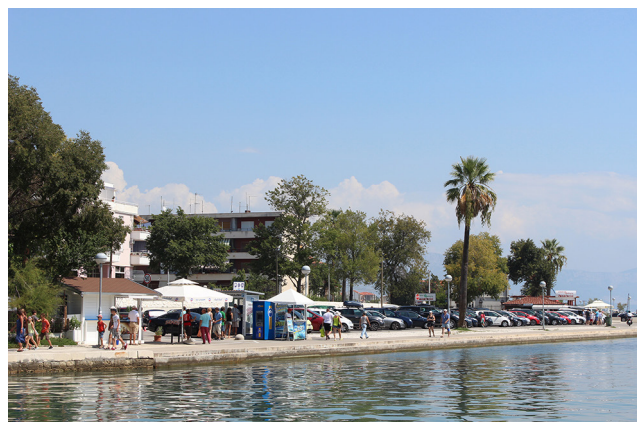
Slika 8 Park Slade-Šilović (prije Casotti), stanje prije preinaka