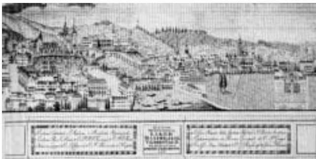
Faksimil Szemanove vedute Zagreba iz 1825. (izrađen 1991.).