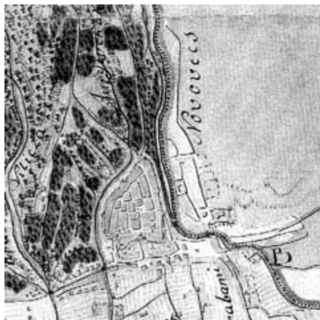
Isječak faksimila Kneidingerove karte Zagreba iz 1766. (izrađen 1977.).