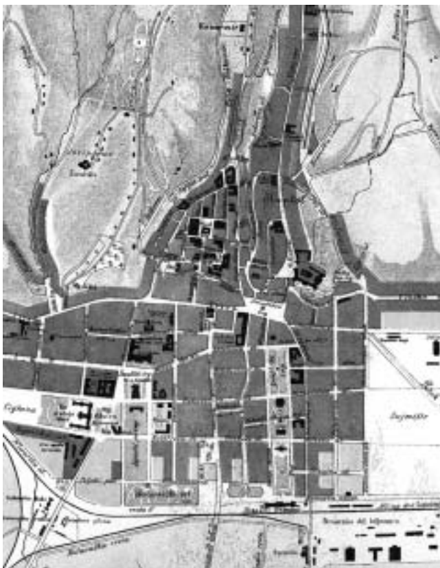
Isječak faksimila Kneidingerove karte Zagreba iz 1766. (izrađen 1977.).