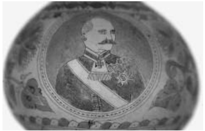
Lik bana Josipa Jelačića na slavonskoj tikvici