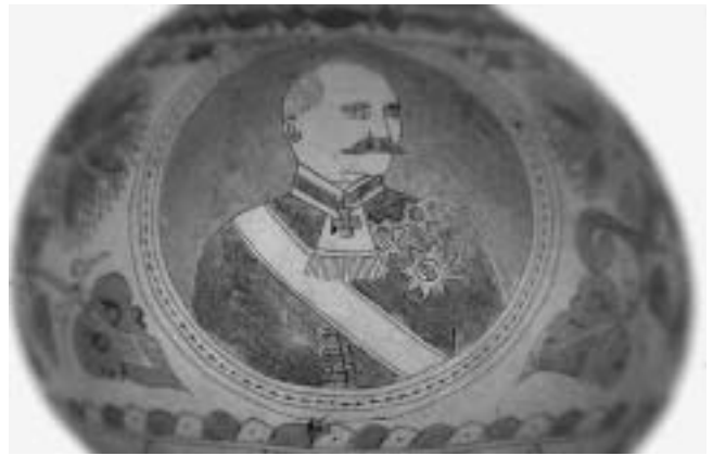
Lik bana Josipa Jelačića na slavnoskoj tikvici