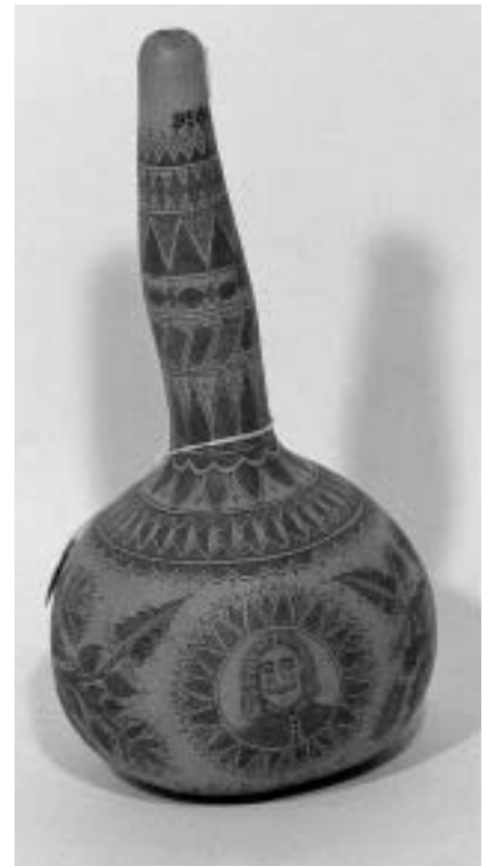
Lik Petra Zrinskoga na slavonskoj tikvici