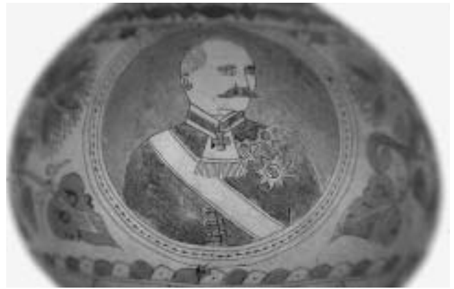
Lik bana Josipa Jelačića na slavnoskoj tikvici