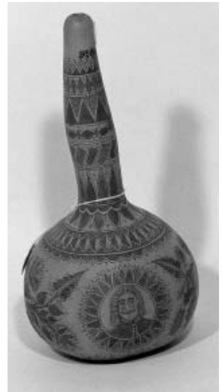
Lik Petra Zrinskoga na slavonskoj tikvici