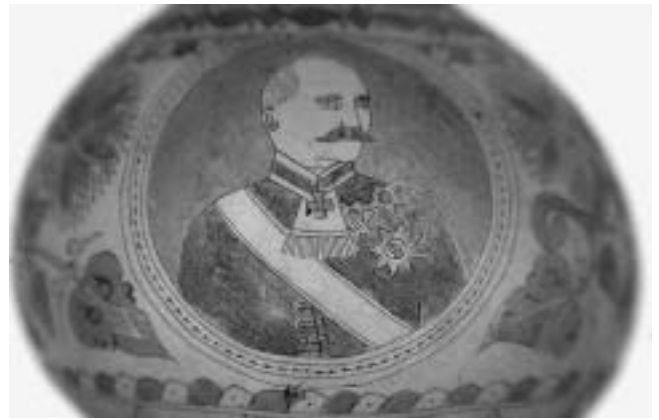
Lik bana Josipa Jelačića na slavonskoj tikvici