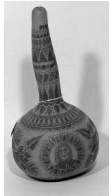
Lik Petra Zrinskoga na slavonskoj tikvici