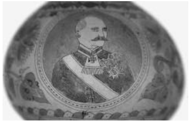
Lik bana Josipa Jelačića na slavonskoj tikvici