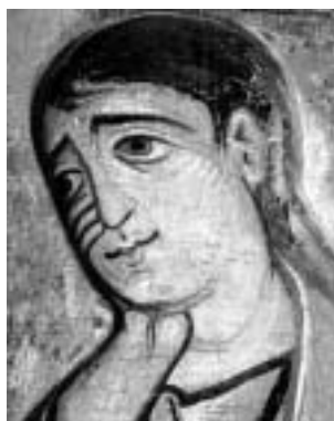
Sv. Ivan, detalj raspela, 12. st., Crkva sv. Frane, Zadar.