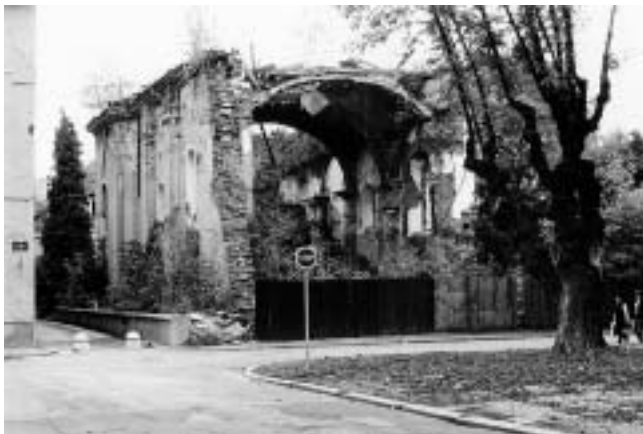
Karlovac, »Zvijezda« Trg bana Jelačića — ruine pravoslavne Crkve sv. Nikole.