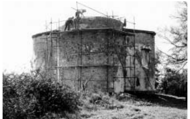
Divuša, kapela sv. Katarine — trikonhos u obnovi.