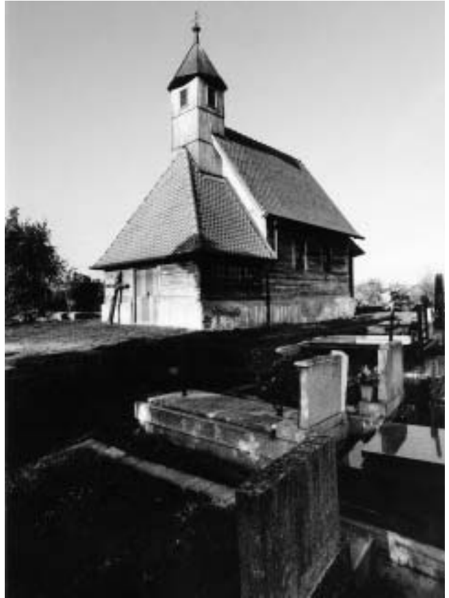
Brest — rekonstruirana kapela sv. Barbare.