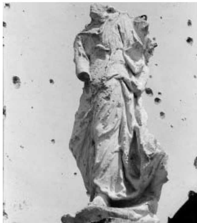
Vukovar — Kip pred pročeljem Crkve sv. Filipa i Jakova. Oštećena skulptura na pilu desno uz zvonik.