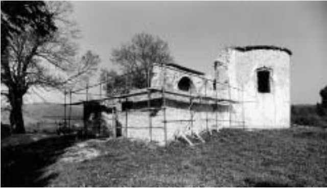
Divuša, kapela sv. Katarine — dogradnja zbog zvonika koji nagrđuje izvorni oblik trikonhosa.