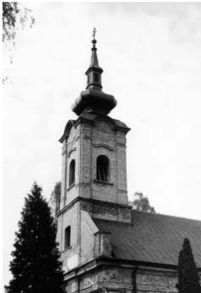
Jasenovac, župna crkva sv. Nikole — nakon obnove.