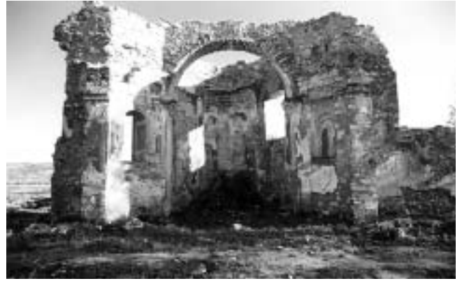
Divuša, kapela sv. Katarine — ruševine trikonhosa nakon čišćenja.