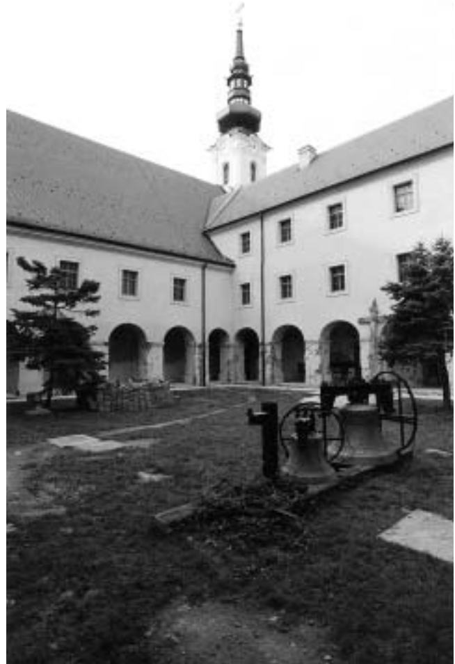
Vukovar — klaustar franjevačkog samostana. Južno krilo / hodnik uz crkvu.

Vukovar — Klaustar franjevačkog samostana nakon obnove samostana.