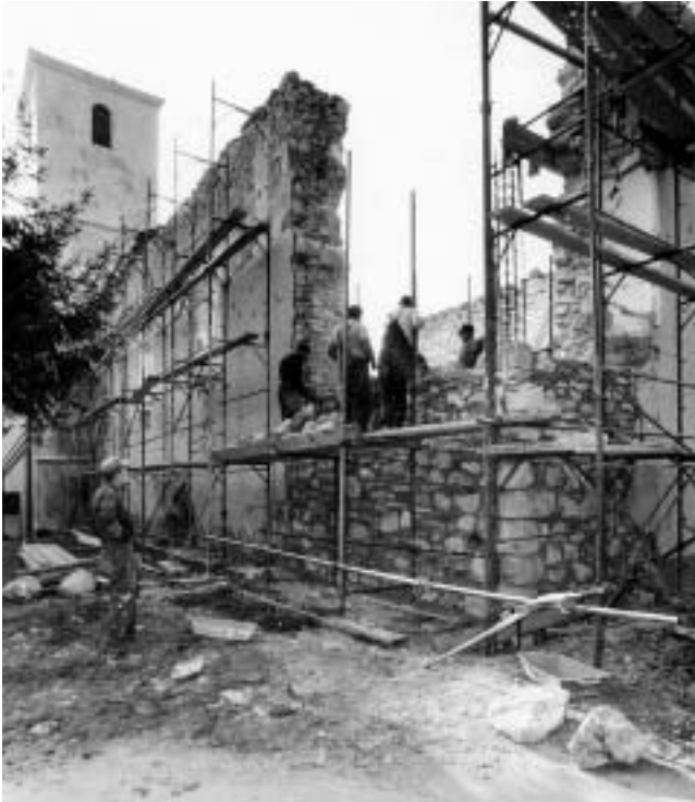
Čuntić — obnova ruševne crkve franjevačkog samostana od kamena nađenog u ruini. (Foto: Milan Drmić, Institut za povijest umjetnosti)

Hrvatska Kostajnica — obnovljena franjevačka Crkva sv. Antuna Padovanskog. (Foto: Milan Drmić, Institut za povijest umjetnosti)