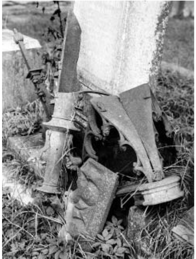
Jasenovac — devastirani spomenici katoličkog groblja.