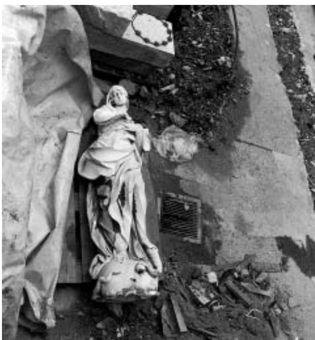
Karlovac, »Zvijezda« — mramorni kip Bezgrješne kipara Francesca Robbe s pila na trgu Bana Jelačića prije prenosa u Hrvatski restauratorski zavod gdje je obnovljen.