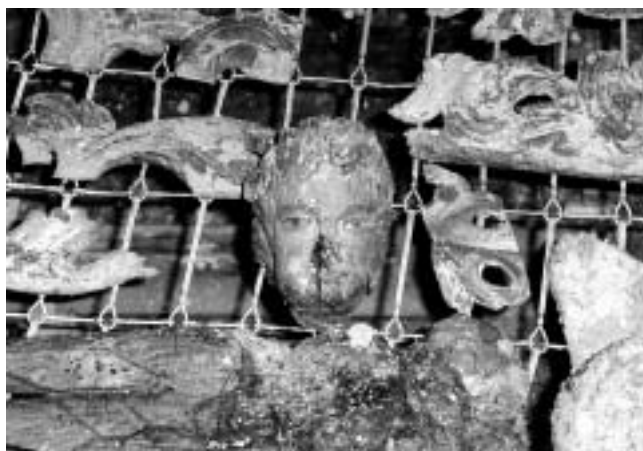
Kamensko, Pavlinski samostan — detalji oštećenih oltara. Crkva demolirana, srušeni svodovi i toranj za okupacije. Obnavlja Hrvatski restauratorski zavod.