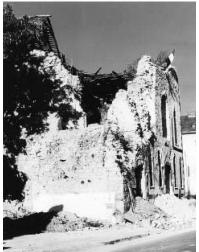
Hrvatska Kostajnica — Franjevačka crkva nakon oslobođenja.