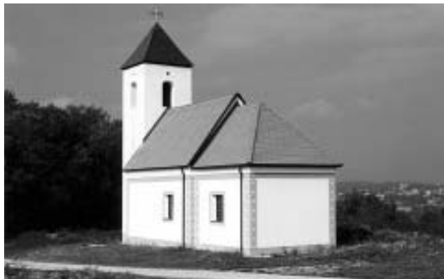
Obnovljena kapela sv. Doroteje u Logorištu, župa Kamensko.