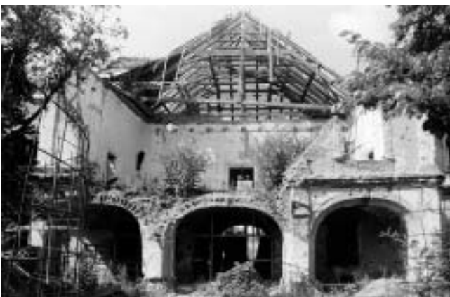
Vukovar — Palača županije. Ostatak rizalita pročelnog krila.

Vukovar — obnovljen rizalit pročelja palače županije.