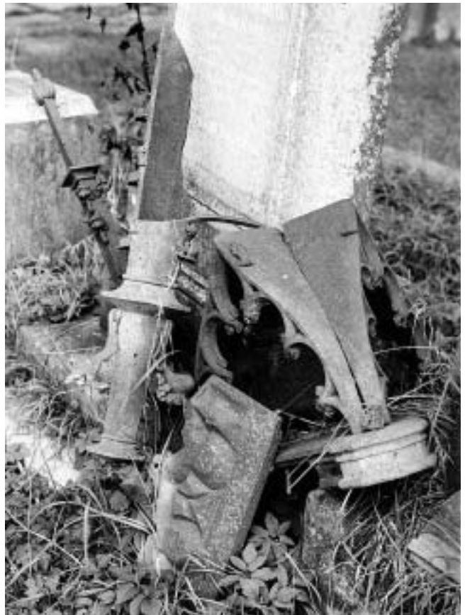
Jasenovac — devastirani spomenici katoličkog groblja.