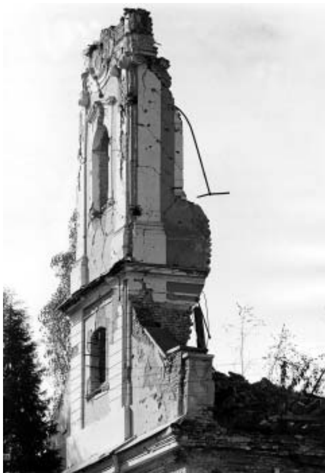
Jasenovac, župna crkva sv. Nikole — ruševni zvonik nakon oslobođenja.