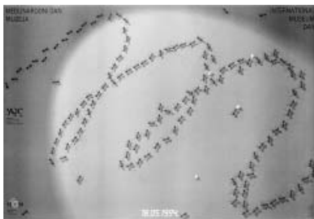
Plakat B. Ljubičića 1994. — M kao muzej ispisuju mravi.