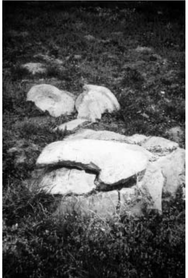
Ivan Meštrović, Porodjenje — uništeni reljef zatečen na stubištu Muzeja nakon oslobođenja.