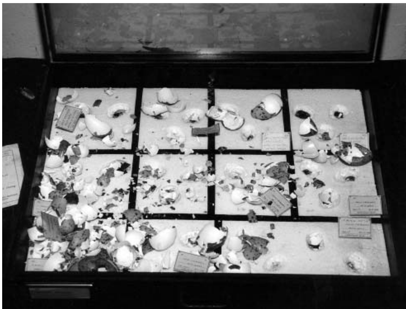
Kutija s namjerno razbijenim jajima iz zbirke Zoološkog muzeja Baranje u Kopačevu. Snimio Davor Javorović, 1997.