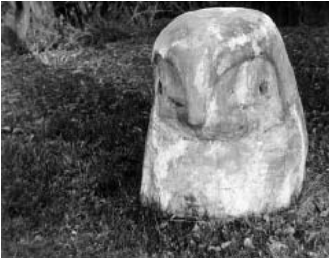
Milena Lah, Kobac — skulptura u vrtu ispred dvorca prije i nakon uništenja.