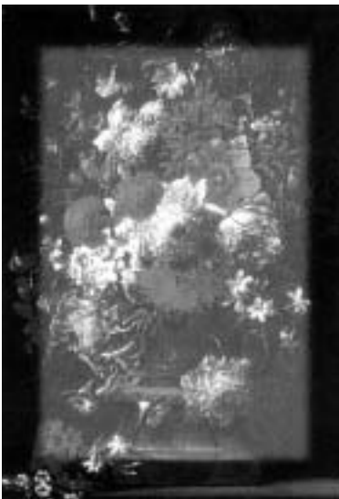
Edukativni katalog Od cvijeta do cvijeta po Strossmayerovoj Galeriji , uz nagradnu muzejsku edukativnu igru zagrebačkih muzeja i muzeja Zagrebačke županije Cvijet , 1997.