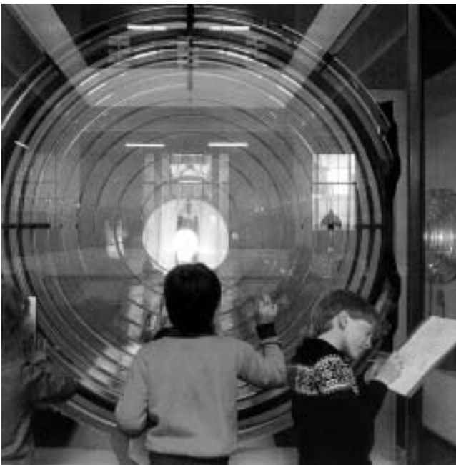
Učenje o hiper svijetlećoj leći iz 1885., dizajn Messrs D & T. Stevenson, National Museums of Scotland, Edinburg, Velika Britanija.