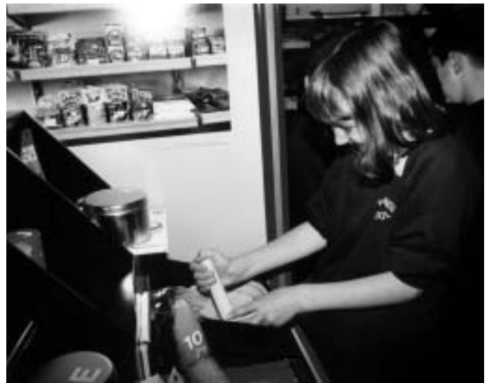
The Discovery Room, Izložba: Discovering Japan , Royal Museum of Scotland, Velika Britanija.