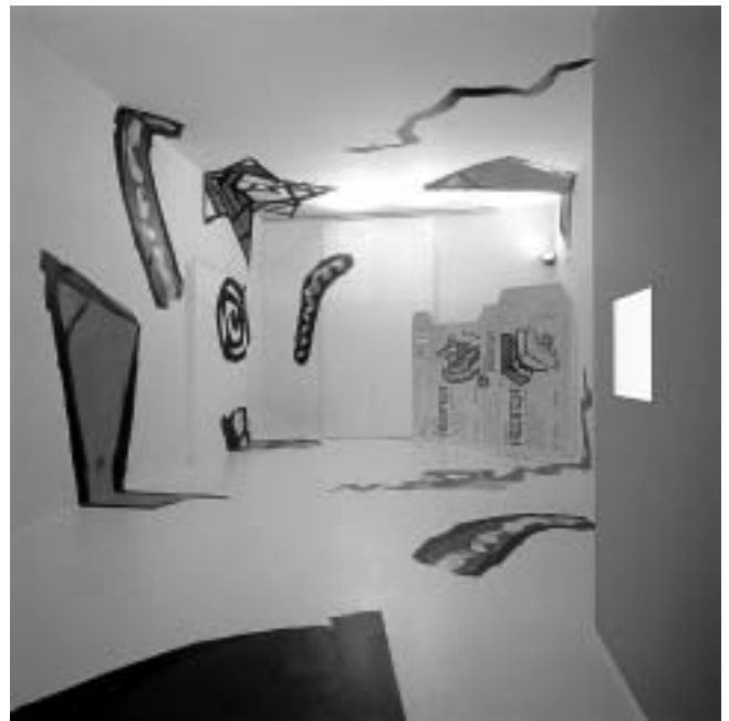
Don't worry, be healthy! , Muzej za umjetnost i obrt, 2001., suradnja MUO-a, tvrtke Belupo i Dizajn studija Rašić, foto: Damir Fabijanić.