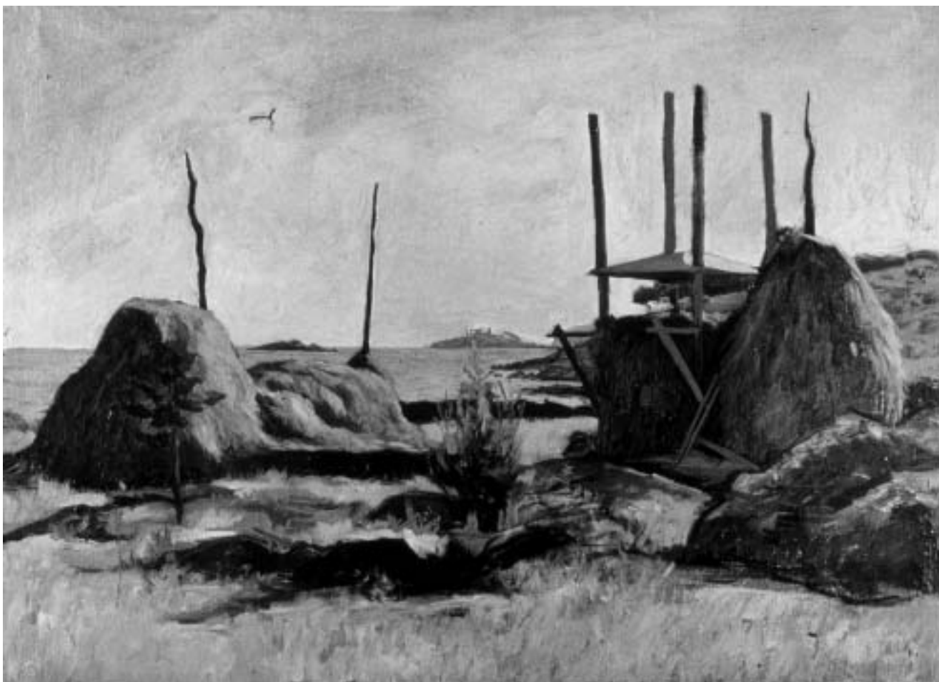
Bruno Mascarelli, Motivo campestre a Polari, 1950., ulje na - platnu, 550x800 mm, Zavičajni muzej grada Rovinja, foto: Damir Matošević.