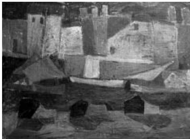
Zora Matić, Motiv iz Rovinja, 1951., ulje na platnu, 730x1010 mm, Zavičajni muzej grada Rovinja, foto: Damir Matošević.