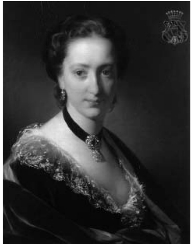
Friedrich Amerling: Alvena pl. Hillebrand-Prandau, 1852., ulje na platnu, 630x540 mm.