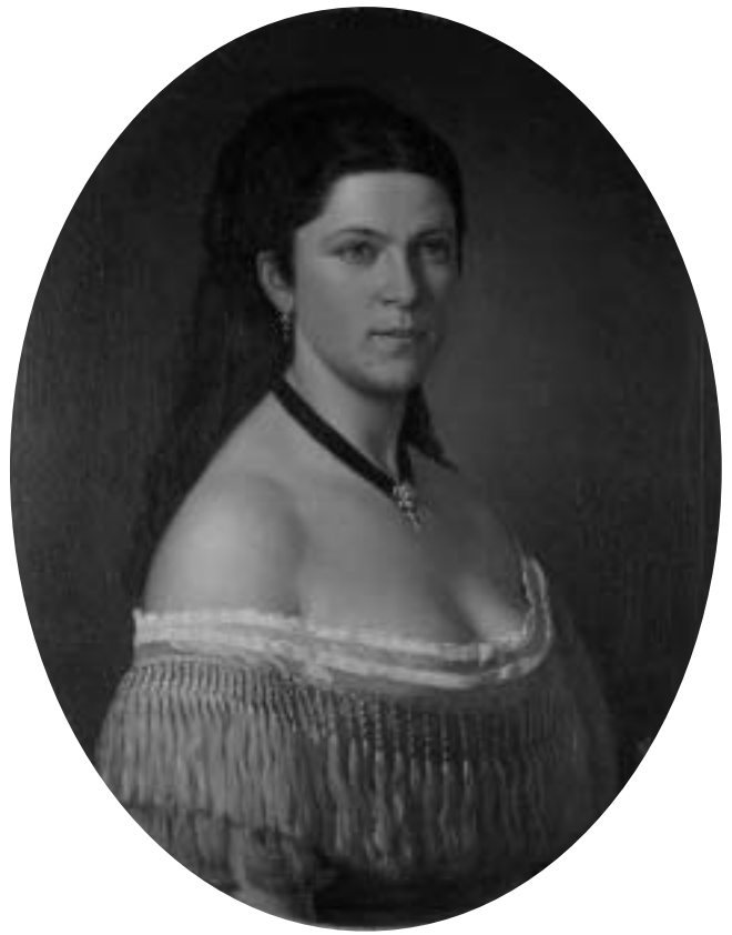
Giovanni Moretti: Ženski portret iz obitelji Fischer, 1871., ulje na platnu, 760x625 mm (oval).