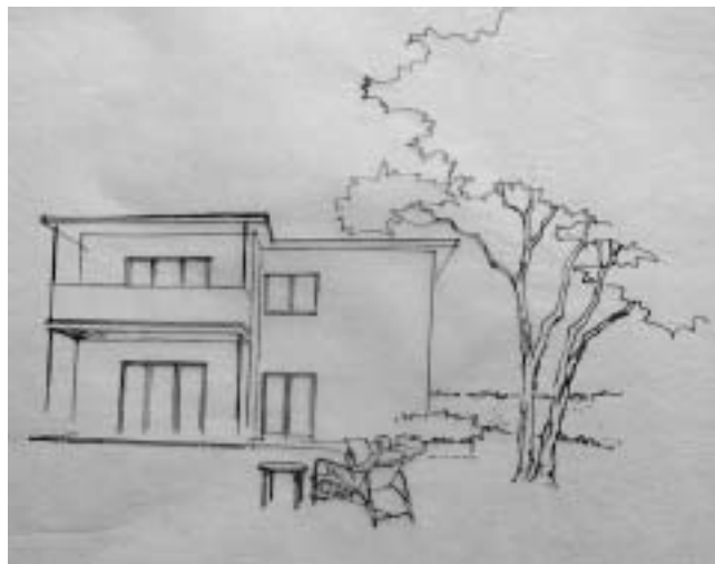
Obiteljska kuća Slavić, perspektiva, inv. br. MGZ 8253.