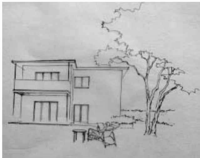
Obiteljska kuća Slavić, perspektiva, inv. br. MGZ 8253.