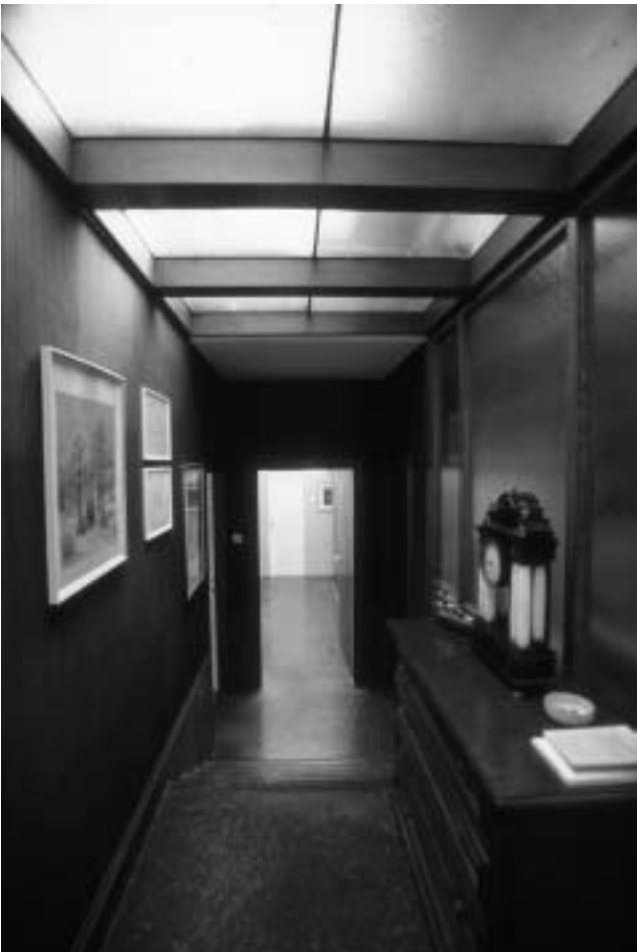
Vila Ladany, interijer, hodnik, današnji izgled.