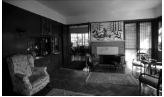
Vila Heinrich, interijer, dnevni boravak, današnji izgled.