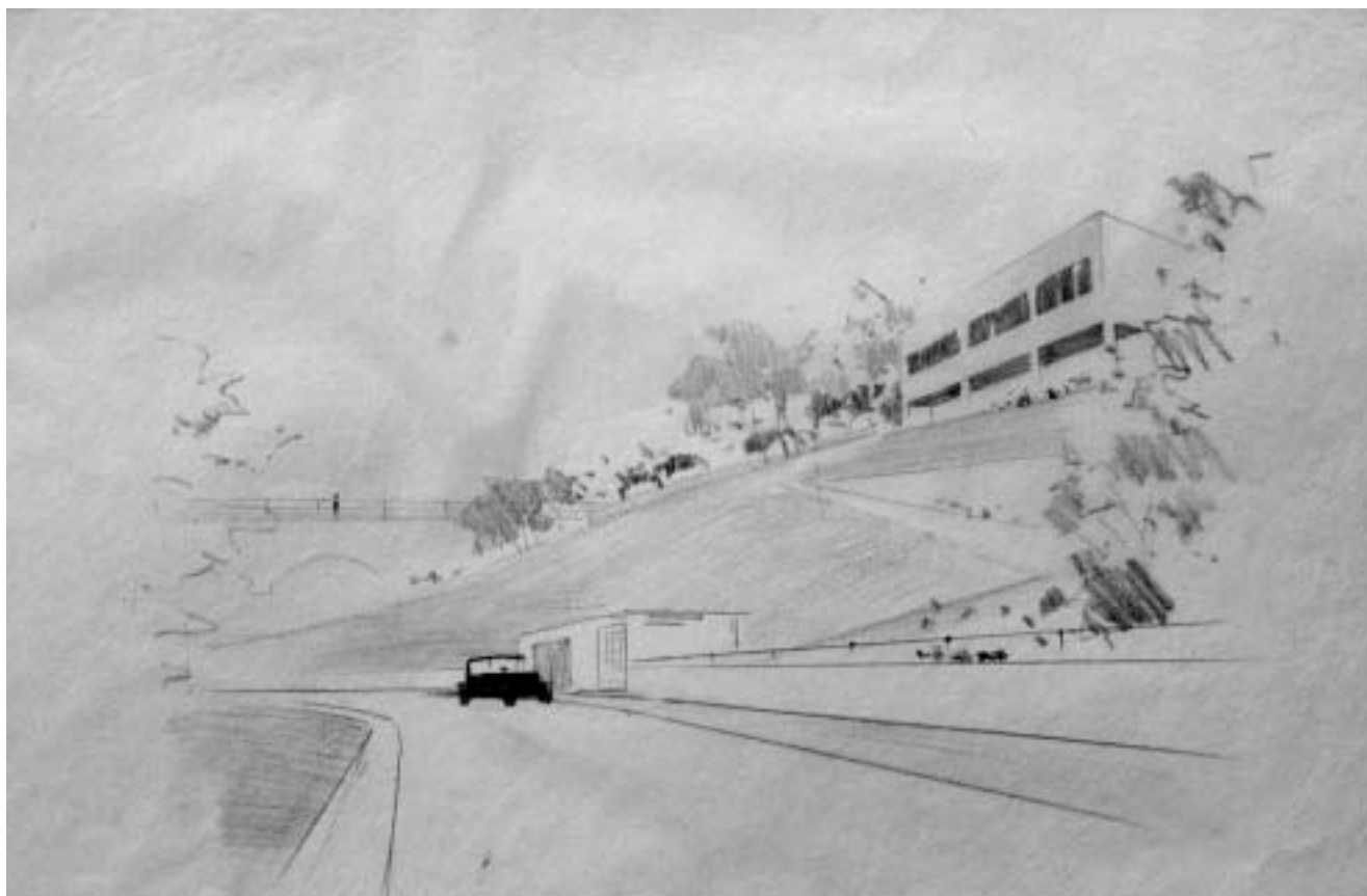
Vila Spitzer, perspektiva, inv. br. MGZ 7591.