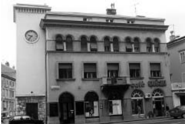
Juraj Denzler, Gradska vijećnica u Sušaku, 1927. Drago Ibler, projekt za Gradsku vijećnicu u Sušaku (neostvareno), 1927.