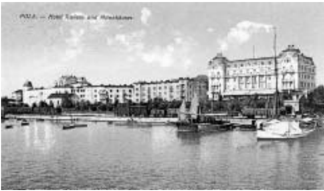
Hotel Riviera i Ville Münz.