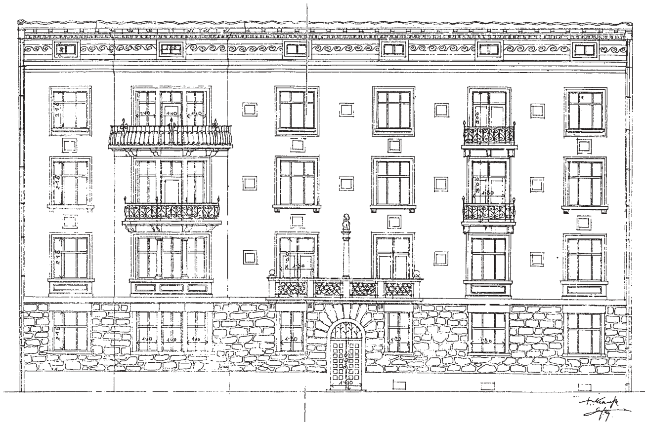
Villa Münz, Akvilejski prilaz 1, nacrt pročelja.