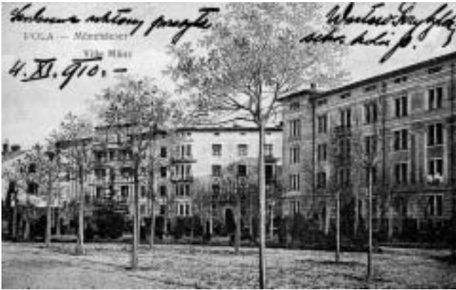
Valerij park i Ville Münz, s desna na lijevo: Ravenska 1 i Akvilejski prilaz 2, Akvilejski prilaz 1, Kolodvorska 10.