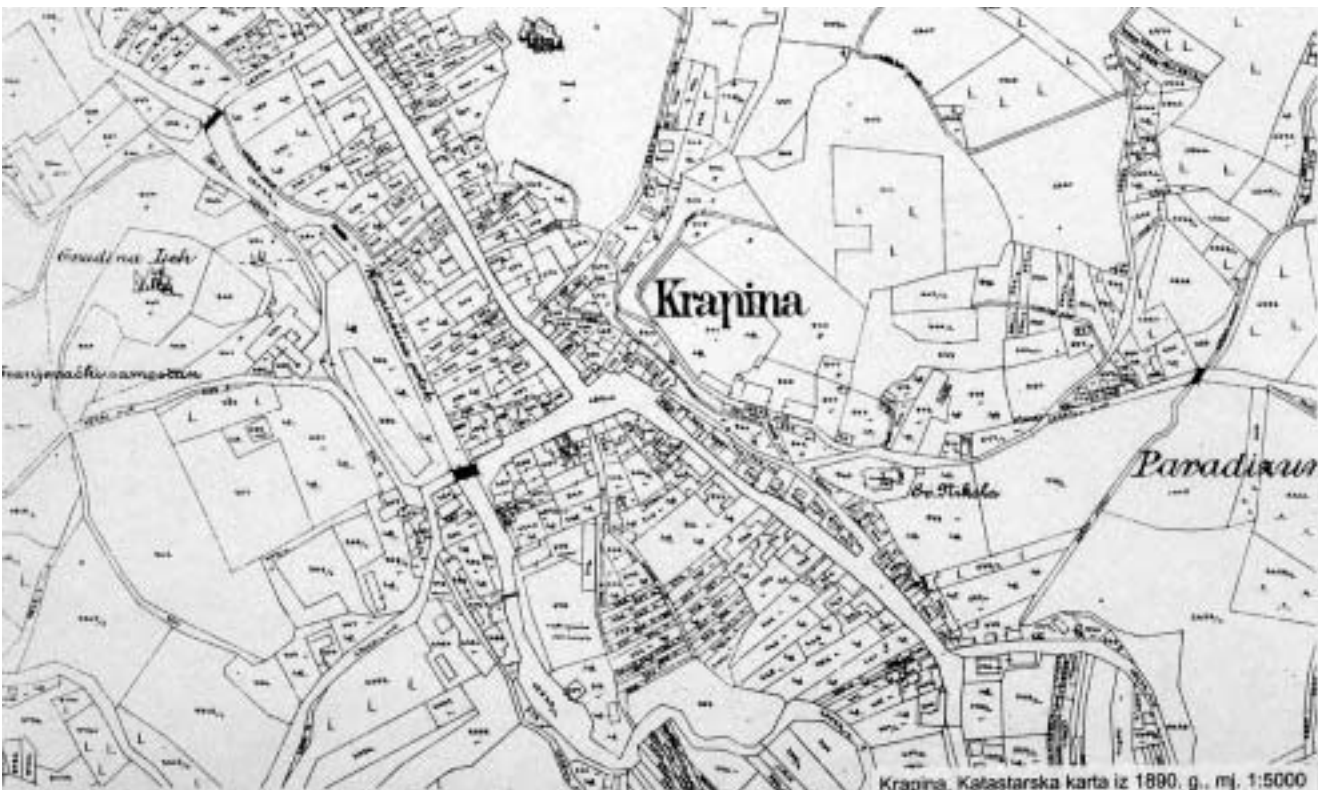
Krapina, katastarska karta iz 1890. g. (Hrvatski državni arhiv u Zagrebu, Kartografska zbirka).