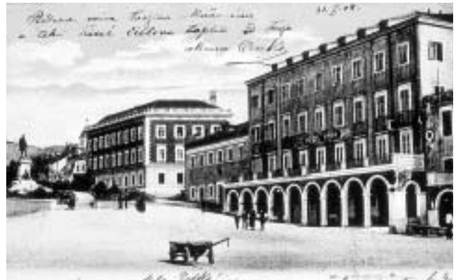
Šibenik, veduta grada s kraja 19. st. (Šibenik, privatna zbirka A. Fantulin).

Trogir, katastarski plan, 1830. (Split, Arhiv mapa za Istru i Dalmaciju).