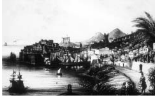
Veduta Dubrovnika s početka 19. st. (Zagreb, Nacionalna i sveučilišna knjižnica).