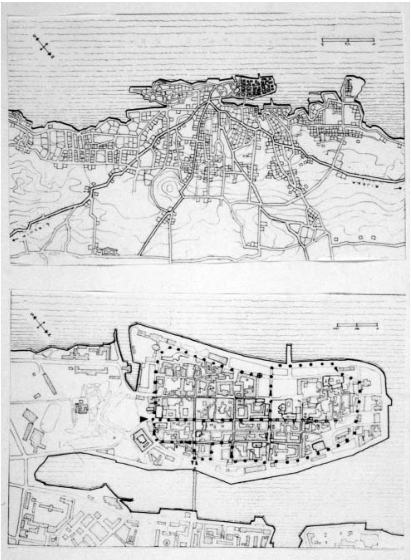
Shematski prikaz zadarskog područja (F. Violich, The Bridge to Dalmatia , 1998.).