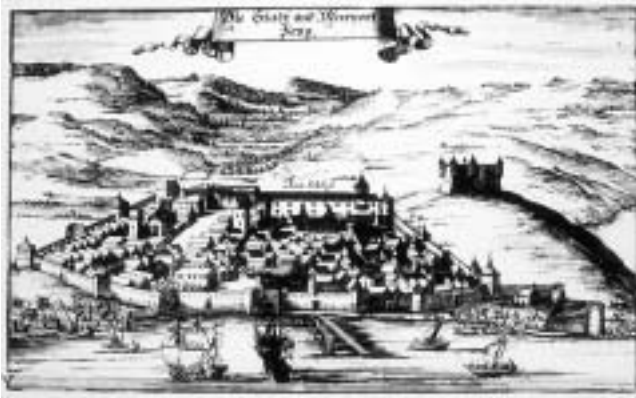
Grafički prikaz Senja s početka 19. st. (Zagreb, Nacionalna i sveučilišna knjižnica).