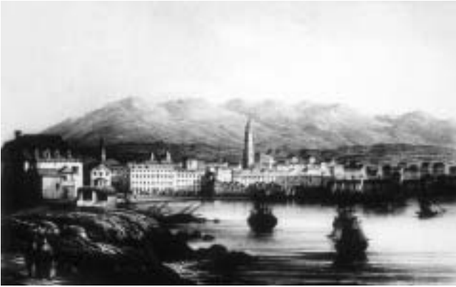
Veduta Splita s početka 19. st. (Zagreb, Nacionalna i sveučilišna knjižnica).