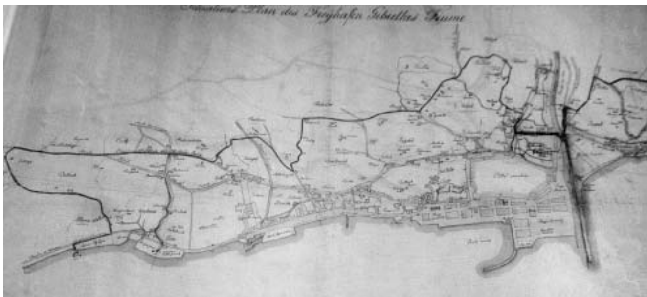
Topografski plan Rijeke, 1888. (Rijeka, Povijesni arhiv).