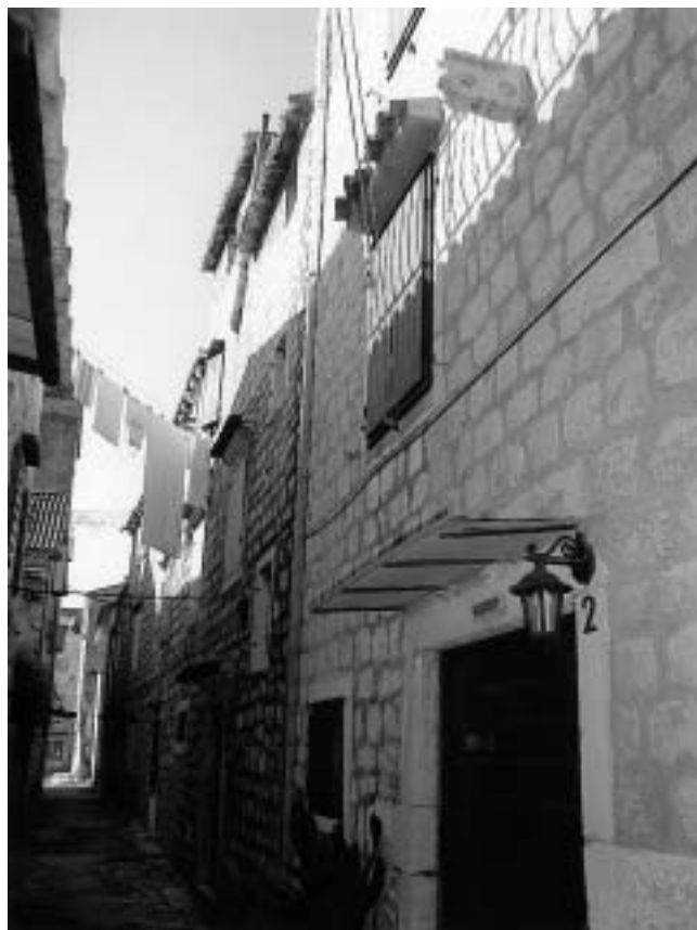
Kuće Macanovićevid u Trogiru ( Macanovića dvori ), detalji