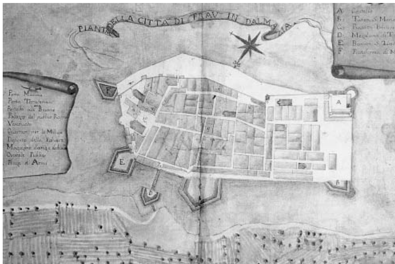
Plan Trogira iz 1755. godine