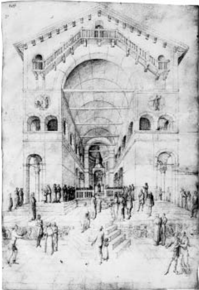
Jacopo Bellini, Ulazak Marije u Hram, crtež, Paris, Louvre, fol. 28 (alte fol. 30)