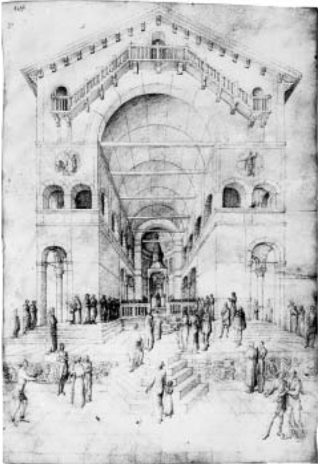
Jacopo Bellini, Ulazak Marije u Hram, crtež, Paris, Louvre, fol. 28 (alte fol. 30)