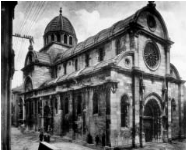
Šibenska katedrala, (foto: Ć. M. Iveković, Dalmatiens Architektur und Plastik, Wien, 1910.)