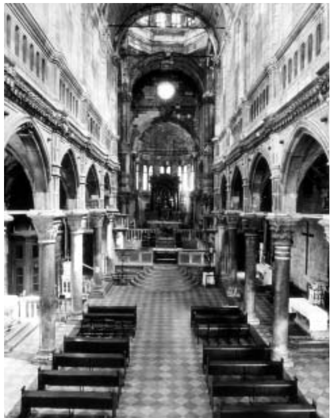
Šibenska katedrala, interijer, (foto: K. Tadić, Institut za povijest umjetnosti, 1975.)