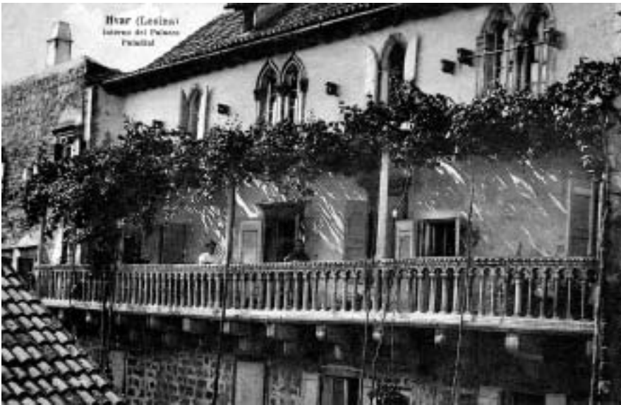
Gornja palača Paladinić