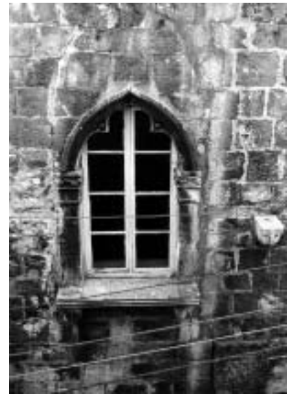
Dio zapadnog pročelja kuće Novak