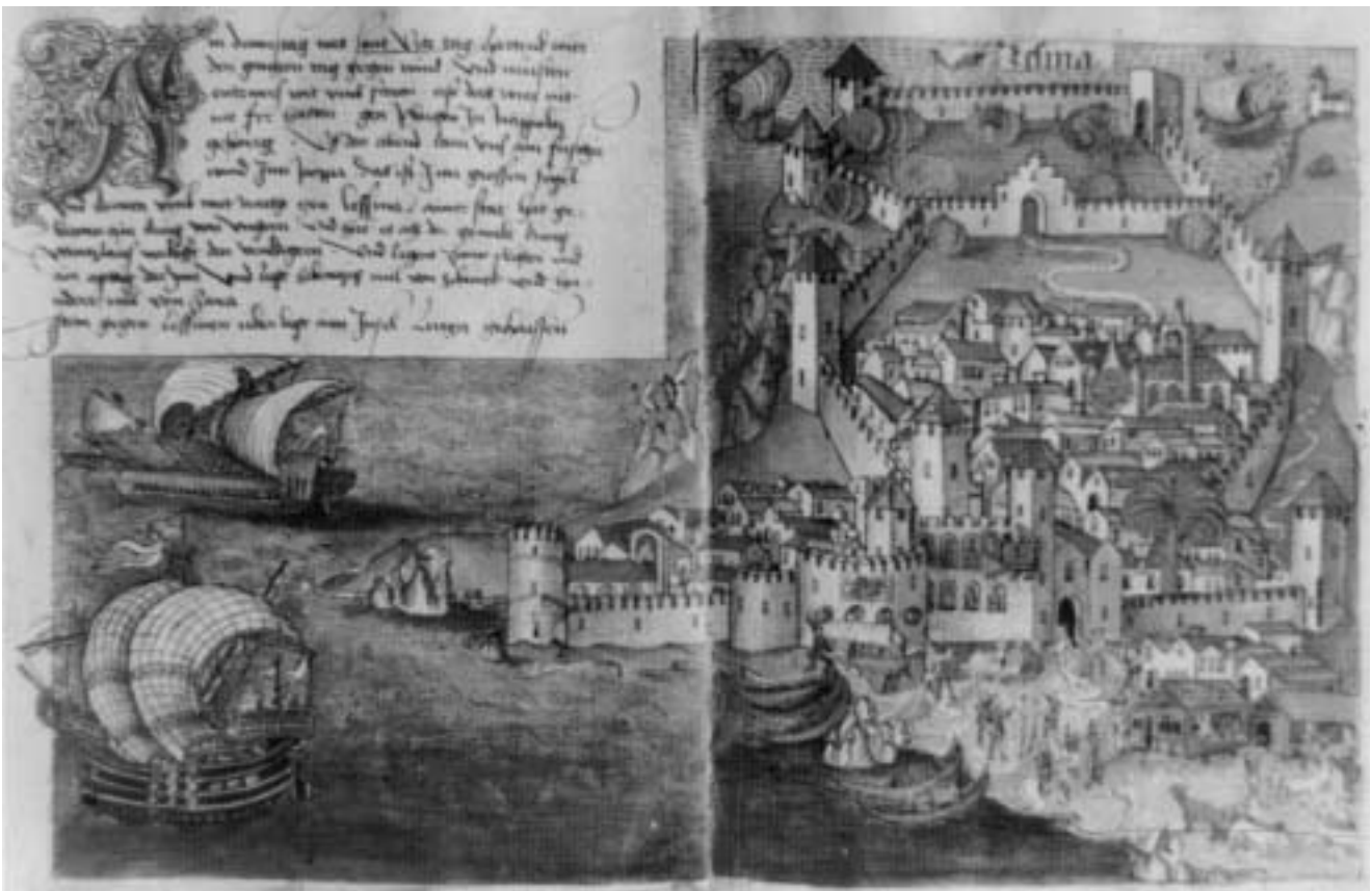
Konrad von Grünenberg, Veduta Hvara iz 1486. g.