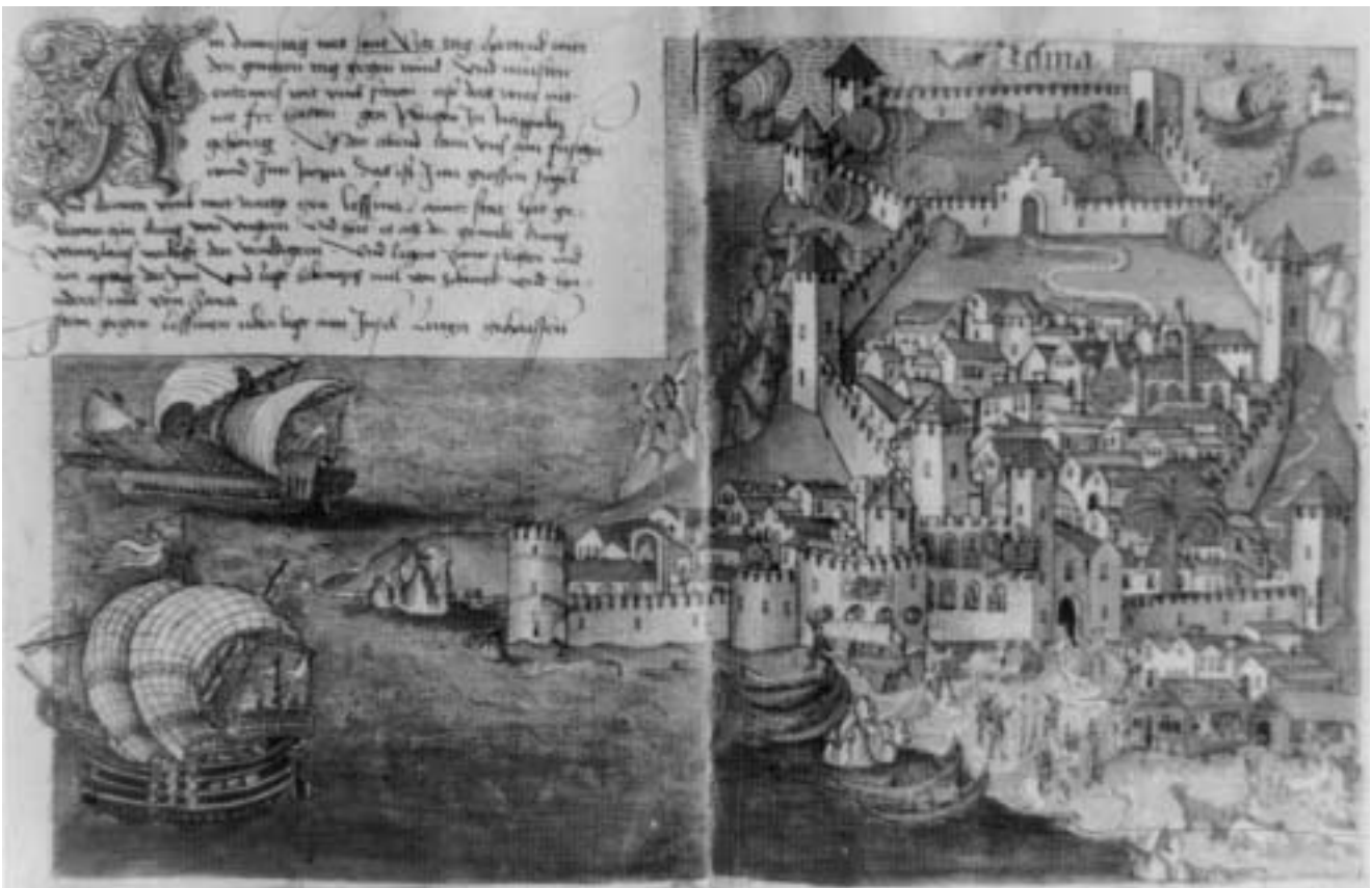
Konrad von Grünenberg, Veduta Hvara iz 1486. g.