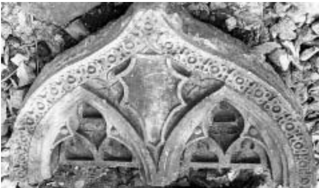
Palača Paladinić na Trgu