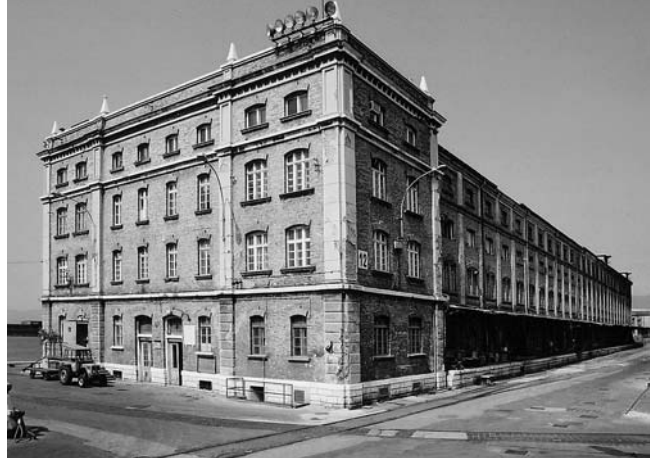
Lučko skladište 12