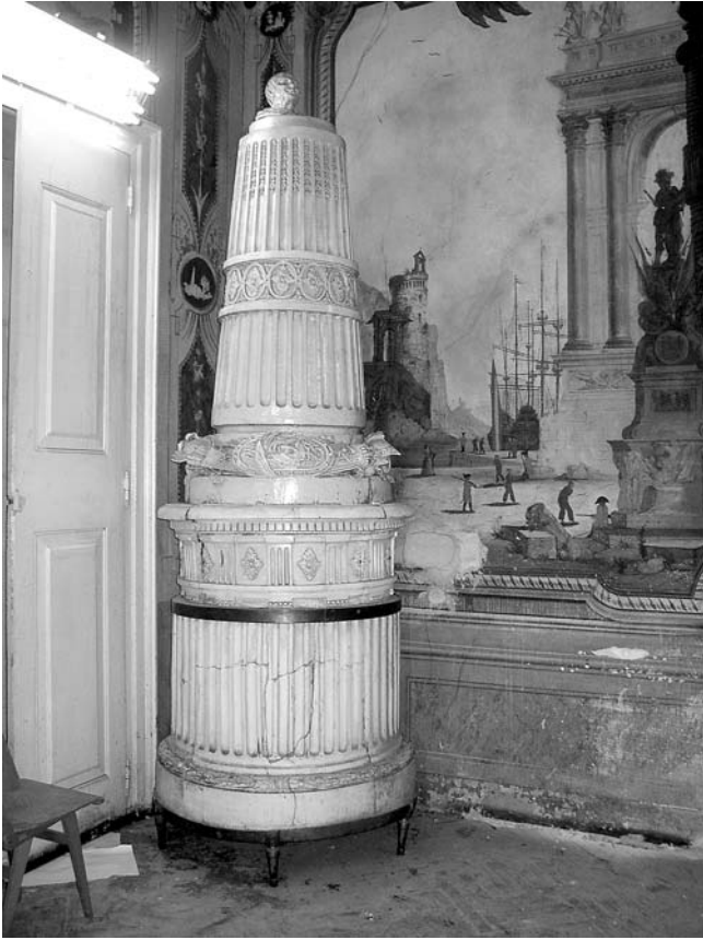
Interijer Šećerane, kaljeva peč