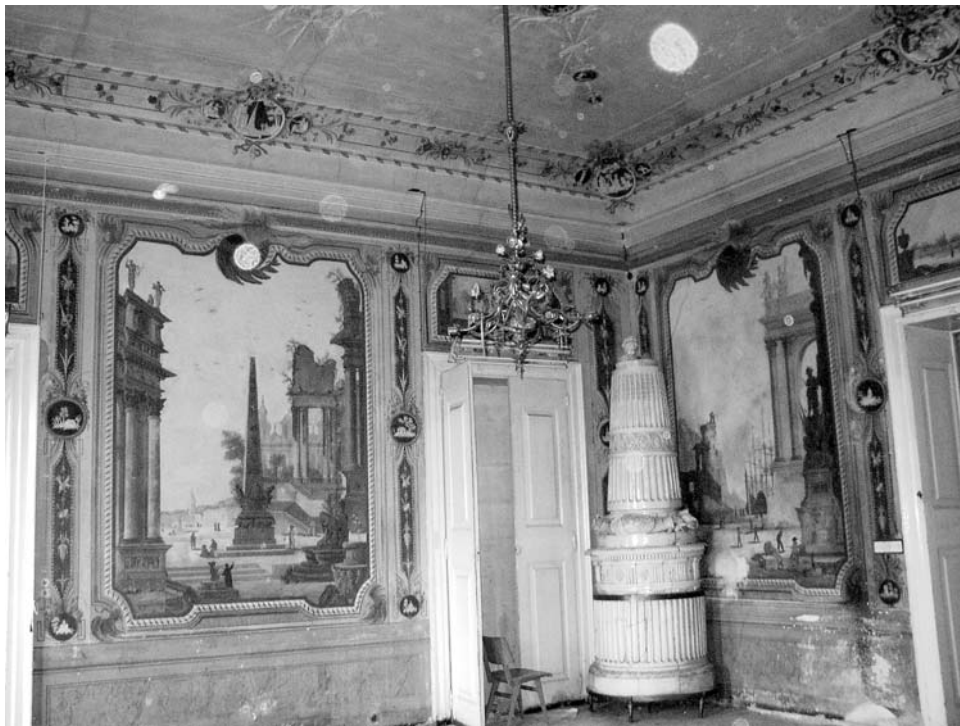
Oslik Malog salona Šećerane, 18. st.