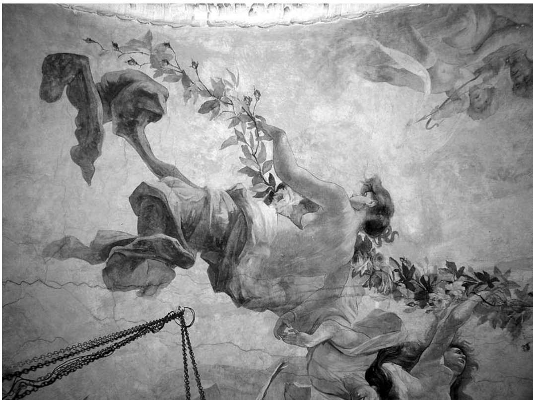
Oslik stropa Šećerane, Giovanni Fumi, kraj 19. st.