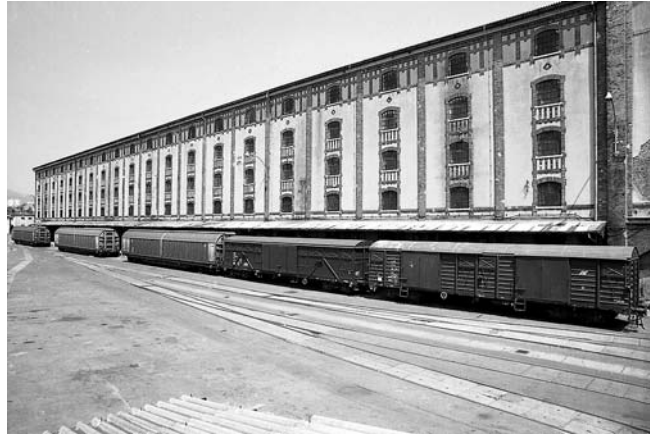
Lučko skladište 23