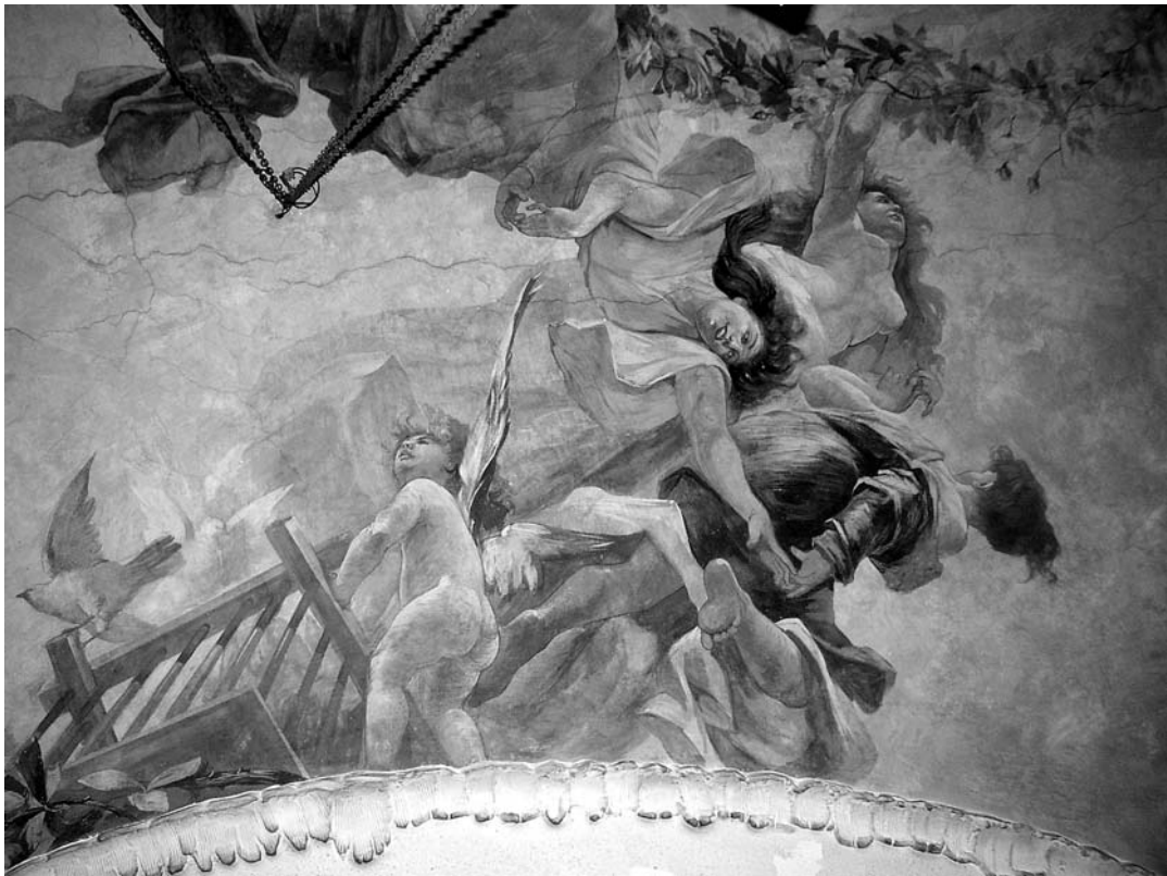
Oslik stropa Šećerane, Giovanni Fumi, kraj 19. st.