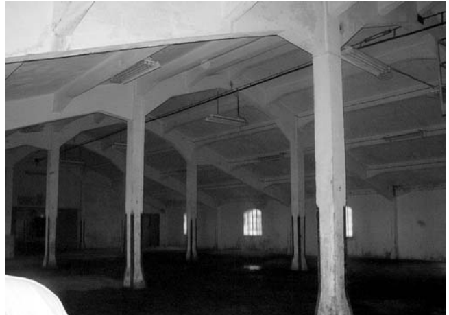
Interijer lučkog skladišta 12