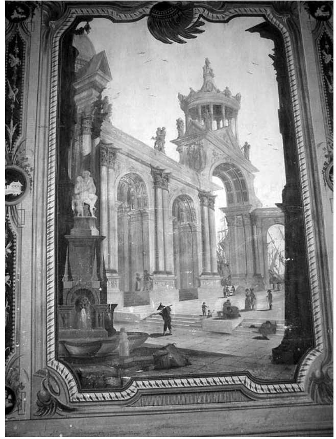
Oslik Malog salona Šećerane, 18. st.