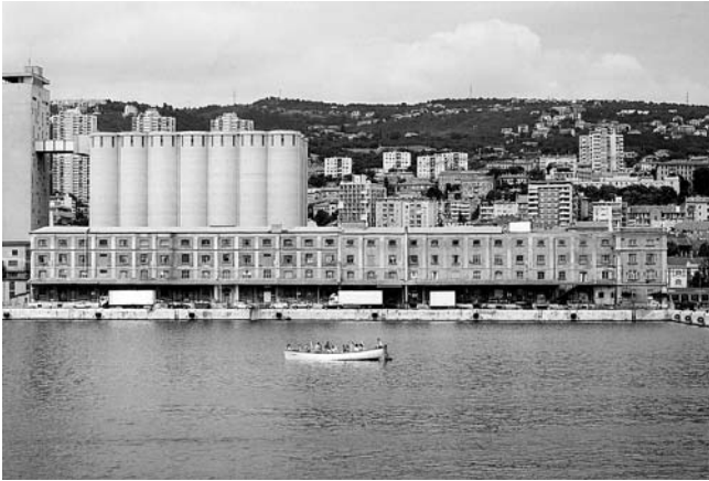
Lučka skladišta 11 i 12