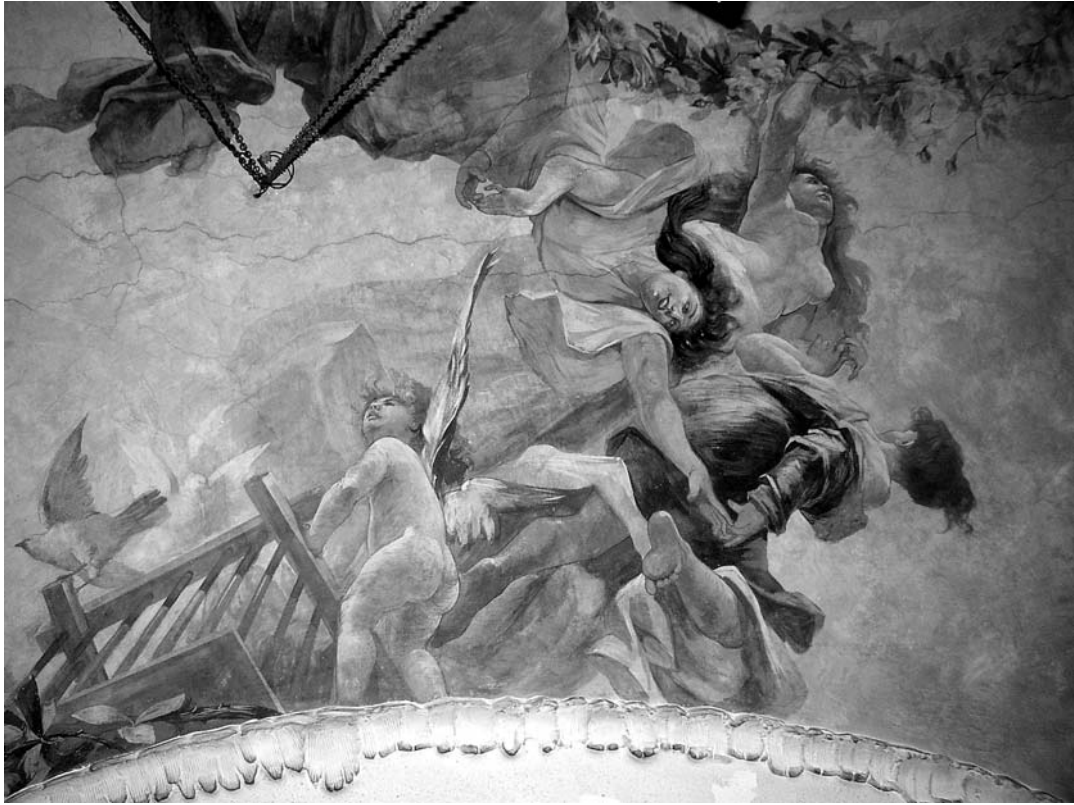
Oslik stropa Šećerane, Giovanni Fumi, kraj 19. st.