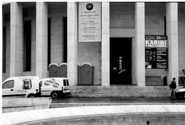
8. SRETNA NOVA 2004! U trijemu spomenika kulture nije umjetnička instalacija već nadomjestak za nepostojanje prateće infrastrukture neophodne kod iznajmljivanja prostora.