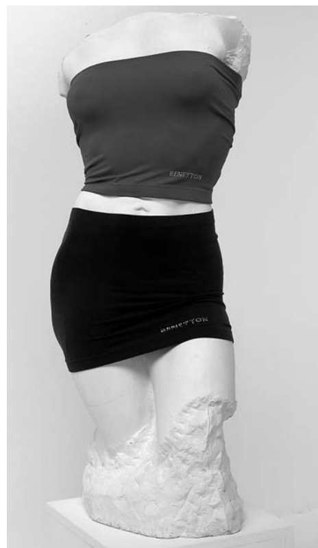
A. Augustinčić, Ženski torzo , 1941. / Benetton