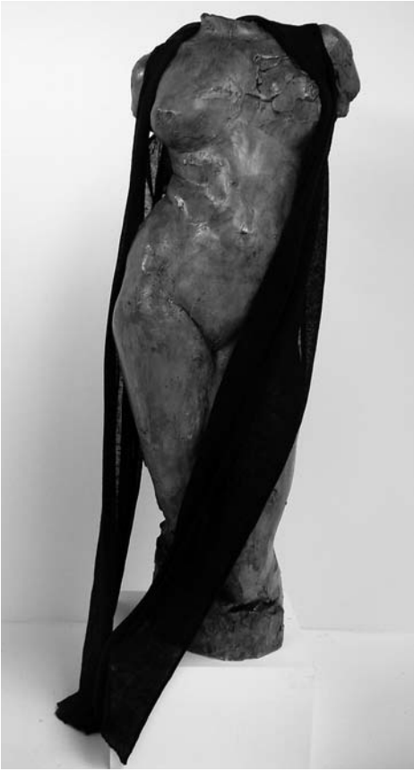
A. Augustinčić, Ženski torzo , 1950.? / Sisley