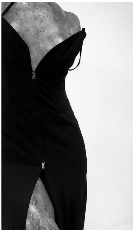
Naslovnica kataloga izložbe