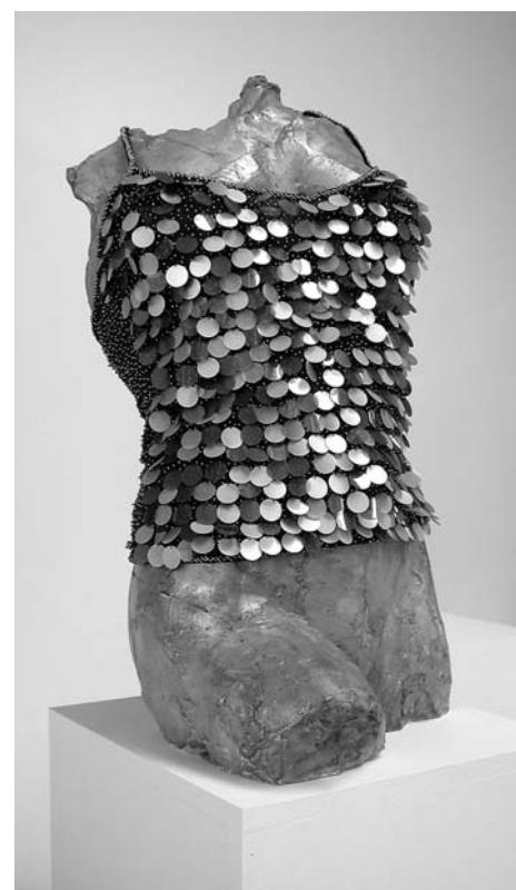
A. Augustinčić, Ženski torzo , 1952. / MarcCain