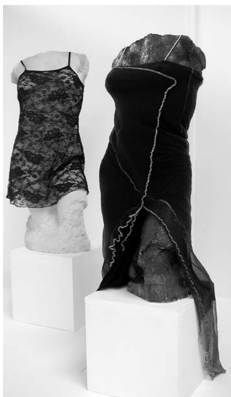
A. Augustinčić, Ženski torzo , 1941. / Lisca A. Augustinčić, Ženski torzo , 1941. / Belinda