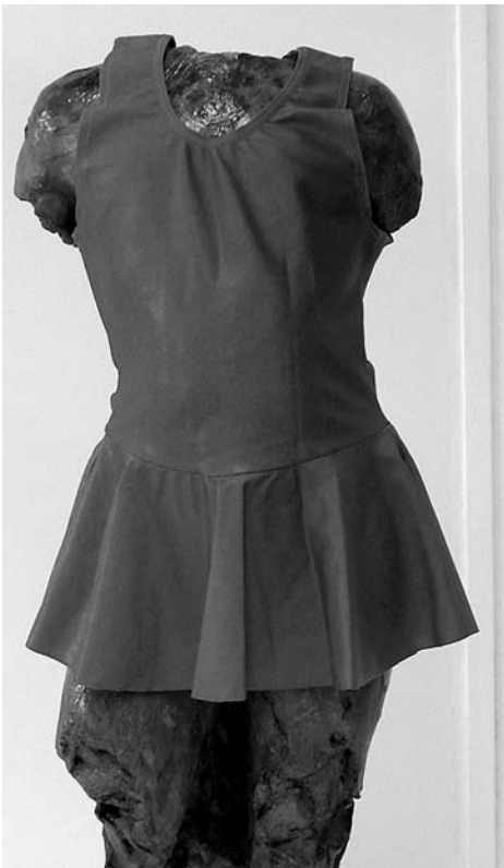
A. Augustinčić, Torzo djevojčice / Rondo