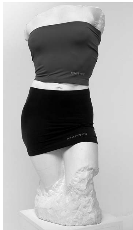
A. Augustinčič, Ženski torzo, 1941.