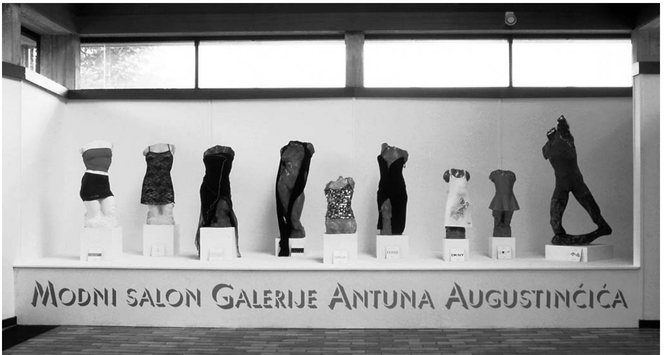
Modni salon Galerije Antuna Augustinčića