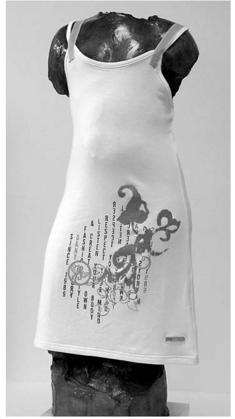
A. Augustinčić, Torzo djevojčice / Dona Karan