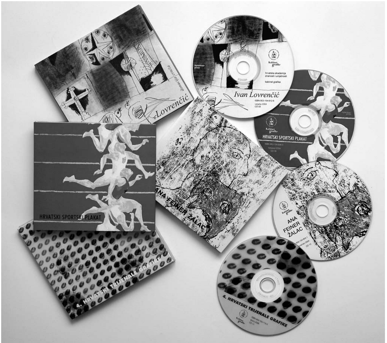
Digitalna izdanja Kabineta grafike HAZU