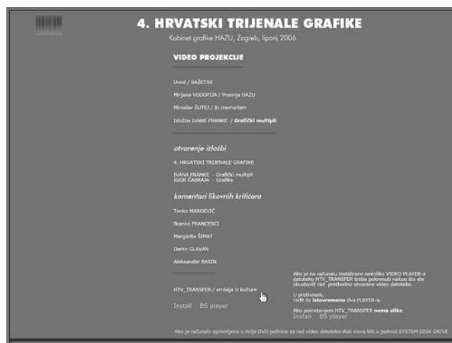
Četvrti hrvatski trijenale grafike, multimedijski interaktivni CD, Kabinet grafike HAZU