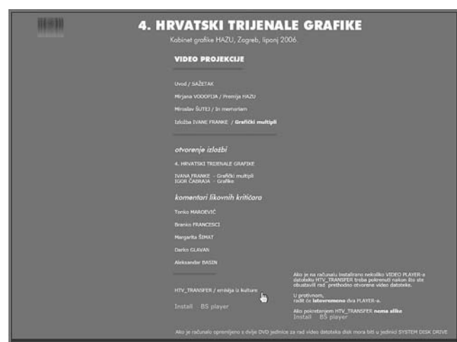
Četvrti hrvatski trijenale grafike, multimedijski interaktivni CD, Kabinet grafike HAZU