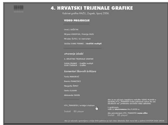
Četvrti hrvatski trijenale grafike, multimedijski interaktivni CD, Kabinet grafike HAZU