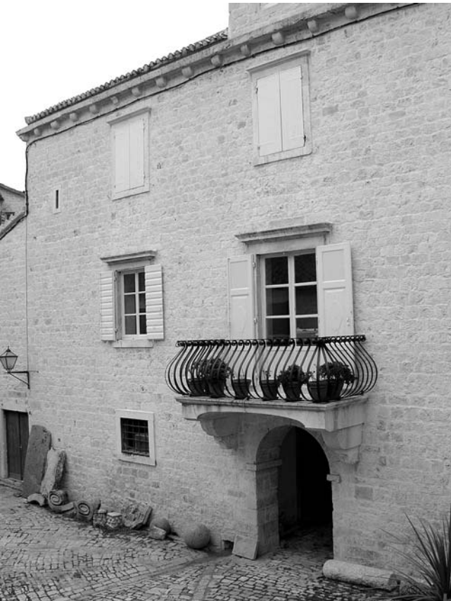
5. Južno pročelje obnovljenog dijela palače Garagnin-Fanfogna.