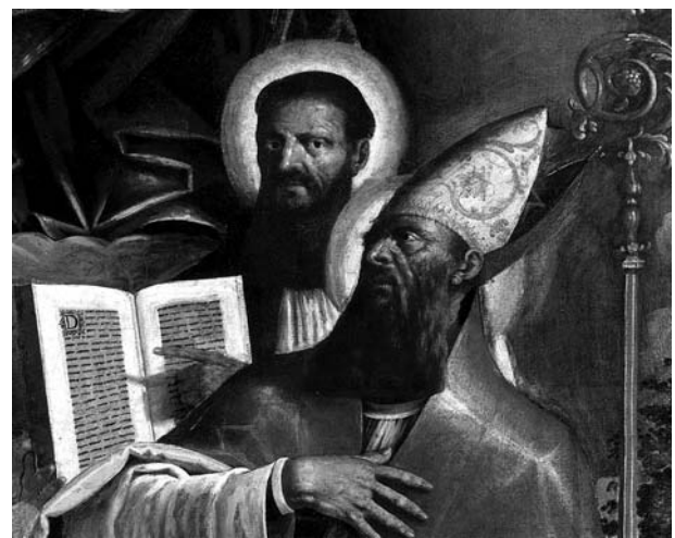
2. Funtana, Župna crkva Sv. Bernarda, oltarna pala Bogorodica s Djetetom, sv. Nikolom, Franjom Asiškim, Bernardom i Antunom Opatom (detalj), Majstor funtanske pale, 1621. ili početak 1622. godine