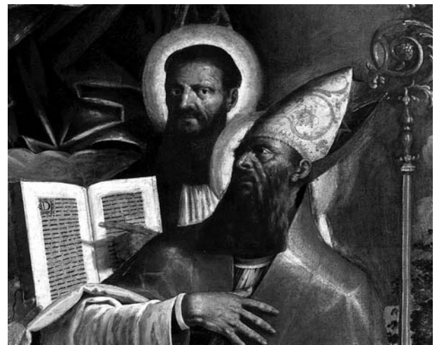
2. Funtana, Župna crkva Sv. Bernarda, oltarna pala Bogorodica s Djetetom, sv. Nikolom, Franjom Asiškim, Bernardom i Antunom Opatom (detalj), Majstor funtanske pale, 1621. ili početak 1622. godine