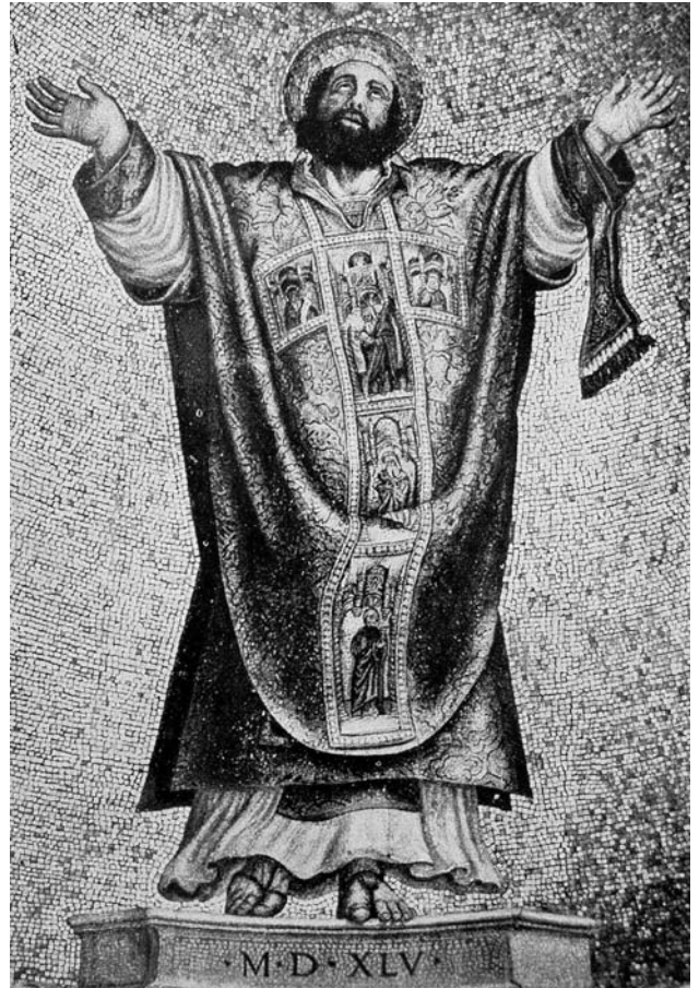
6. Venecija, bazilika Svetog Marka, Francesco i Valerio Zuccato, mozaik s likom svetog Marka