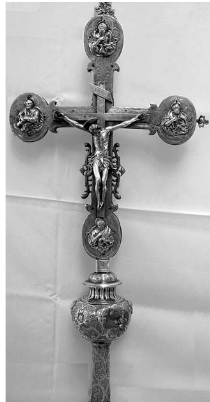
12. Vrbnik, župna crkva Uznesenja Marijina, procesionalno raspelo I, aversu