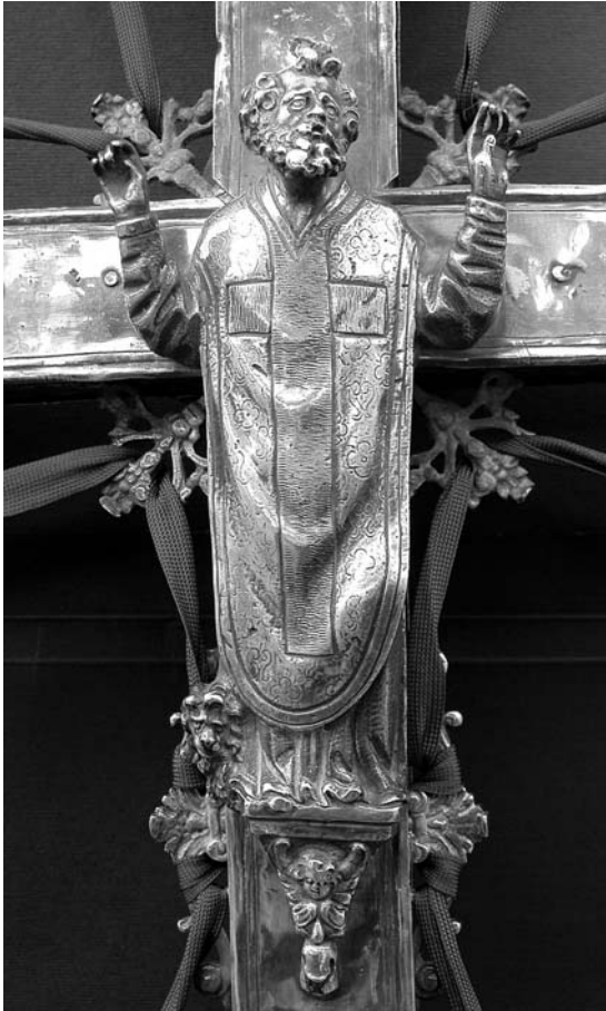
5. Korčula, Opatska riznica Svetog Marka, procesionalno raspelo korčulanskog kaptola, lik svetog Marka na reversu