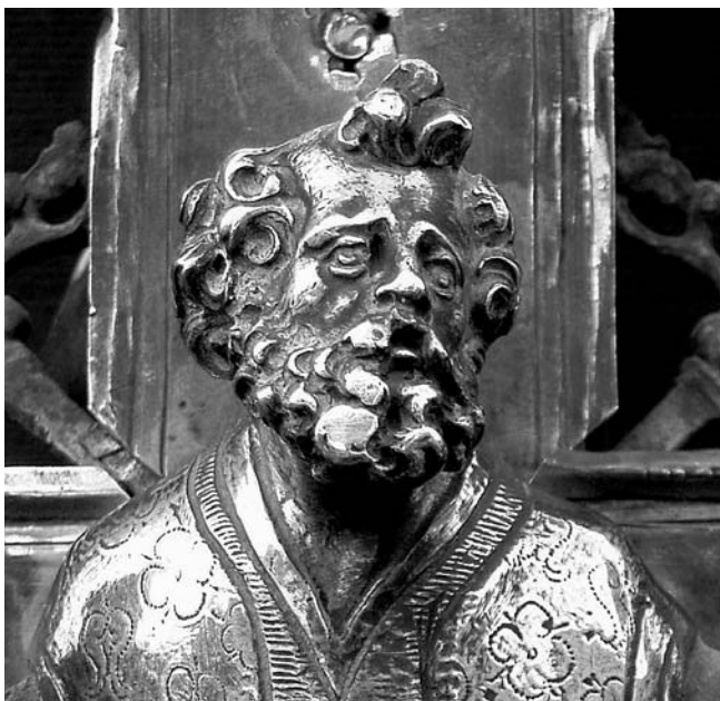
7. Korčula, Opatska riznica Svetog Marka, procesionalno raspelo korčulanskog kaptola, lik svetog Marka na reversu (detalj)