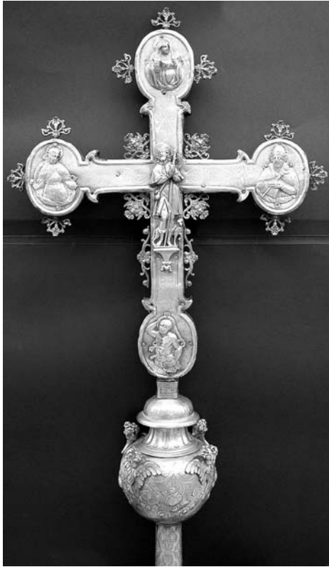
1. Korčula, dvorana bratovštine Svetog Roka, procesionalno raspelo, revers