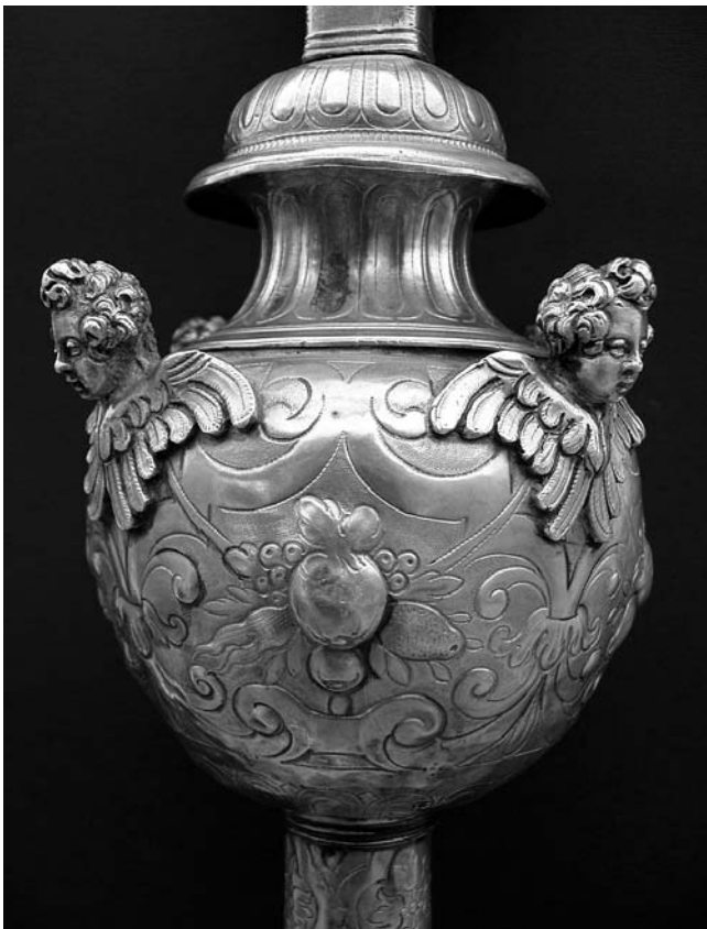
3. Korčula, dvorana bratovštine Svetog Roka, procesionalno raspelo, jabuka