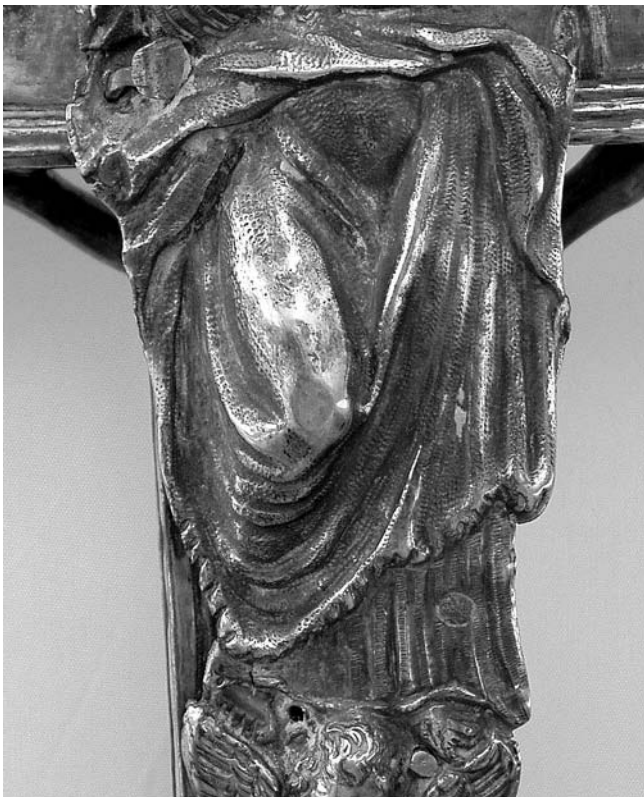
11. Vrbnik, župna crkva Uznesenja Marijina, procesionalno raspelo II, lik Bogorodice na reversu (detalj)