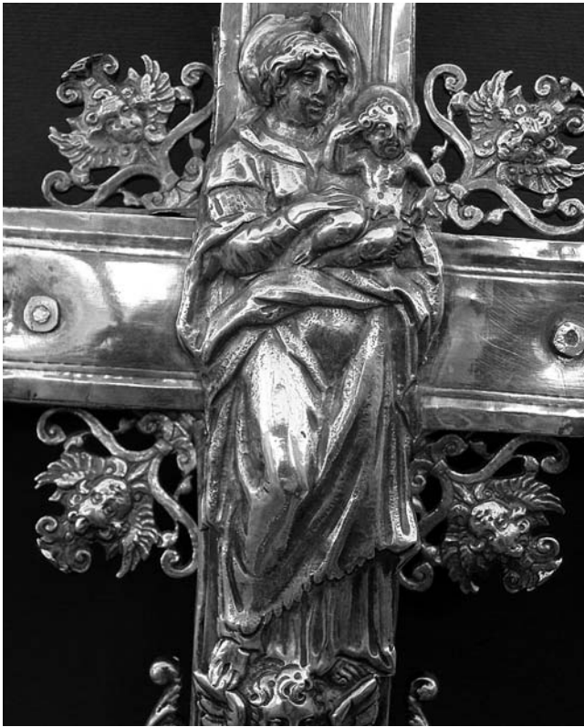
9. Korčula, dvorana bratovštine Blažene Djevice Marije od Utjehe – Pojasa, procesionalno raspelo, lik Bogorodice na reversu