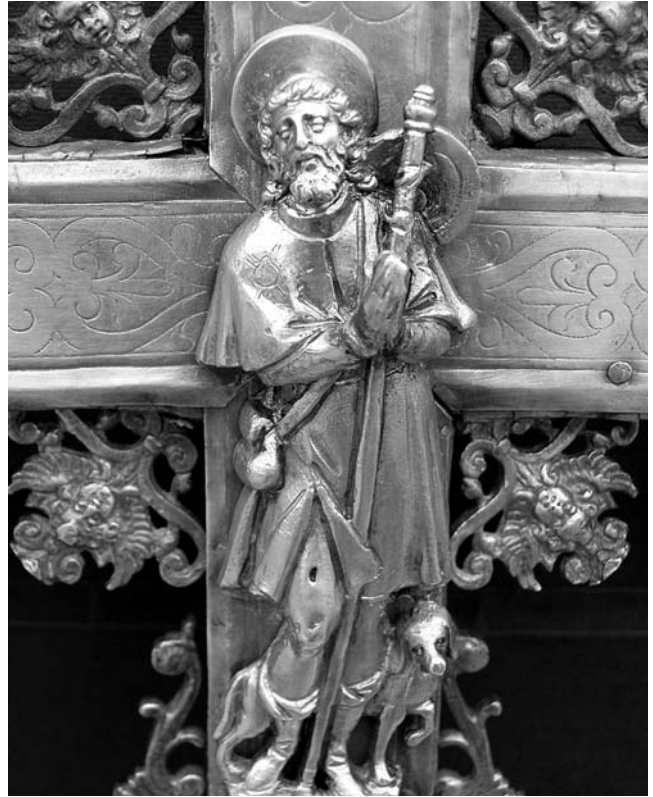
2. Korčula, dvorana bratovštine Svetog Roka, procesionalno raspelo, lik svetog Roka na reversu