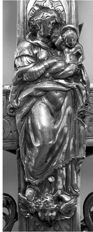
10. Vrbnik, župna crkva Uznesenja Marijina, procesionalno raspelo I, lik Bogorodice na reversu