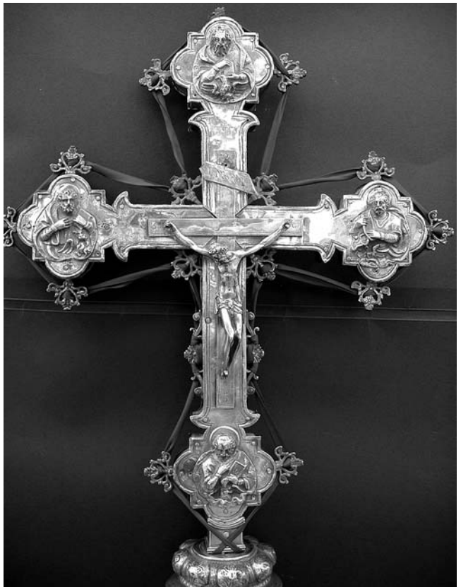
4. Korčula, Opatska riznica Svetog Marka, procesionalno raspelo korčulanskog Kaptola, avers