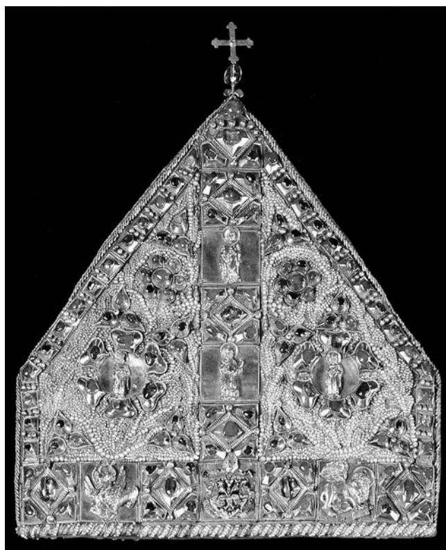
Mitra biskupa Tusza (Riznica zagrebačke katedrale)