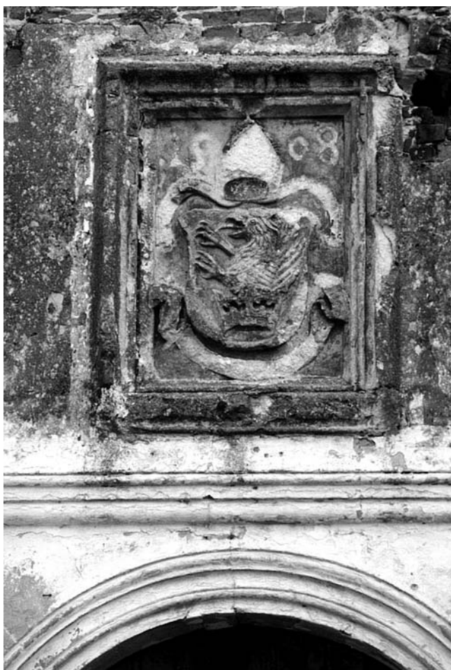
Grb iznad portala