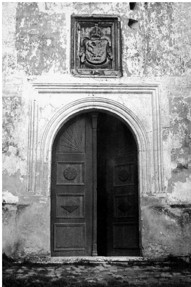
Ulaz u crkvu