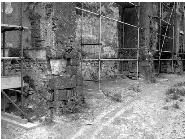
Crkva Sv. Ivana Krstitelja, kontrafor