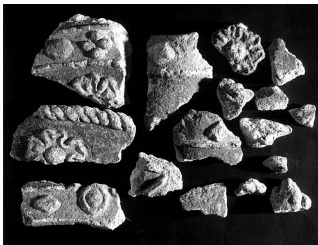
Kameni ulomci iz Kloštar Ivanića (Hrvatski povijesni muzej, Zagreb)