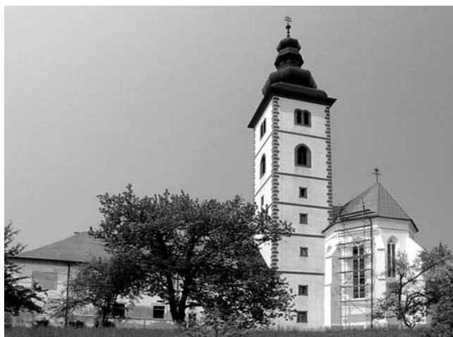
Crkva Sv. Ivana Krstitelja