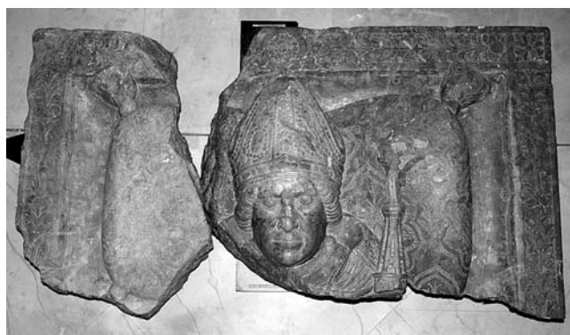
Nadgrobna ploča biskupa Luke (Hrvatski povijesni muzej, Zagreb)