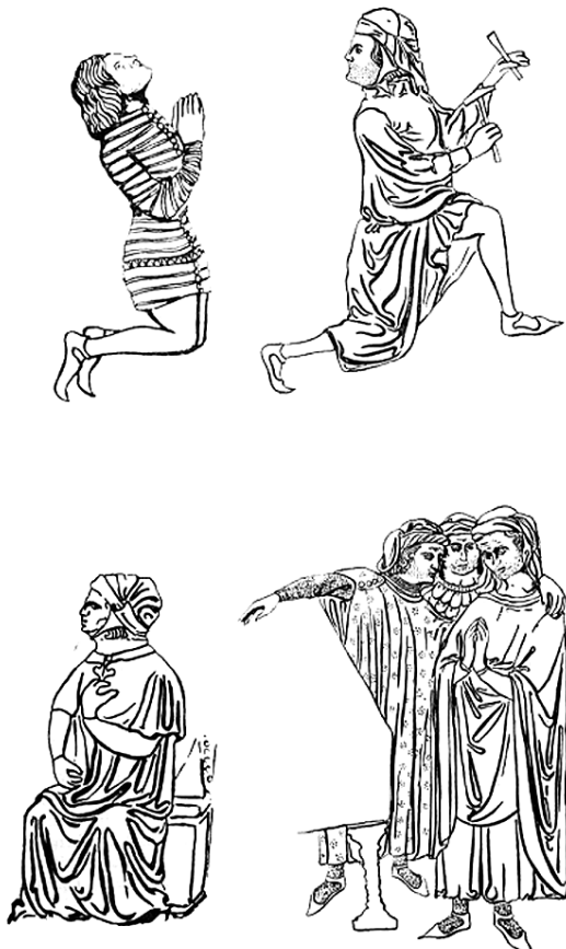
Muška građanska i plemićka nošnja na reljefima škrinje sv. Šimuna