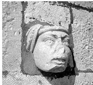
Glava uzidana u svjetionik (original)