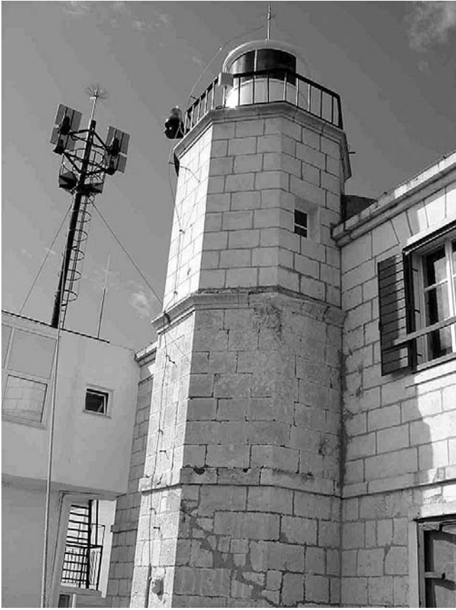
Svjetionik na Jadriji