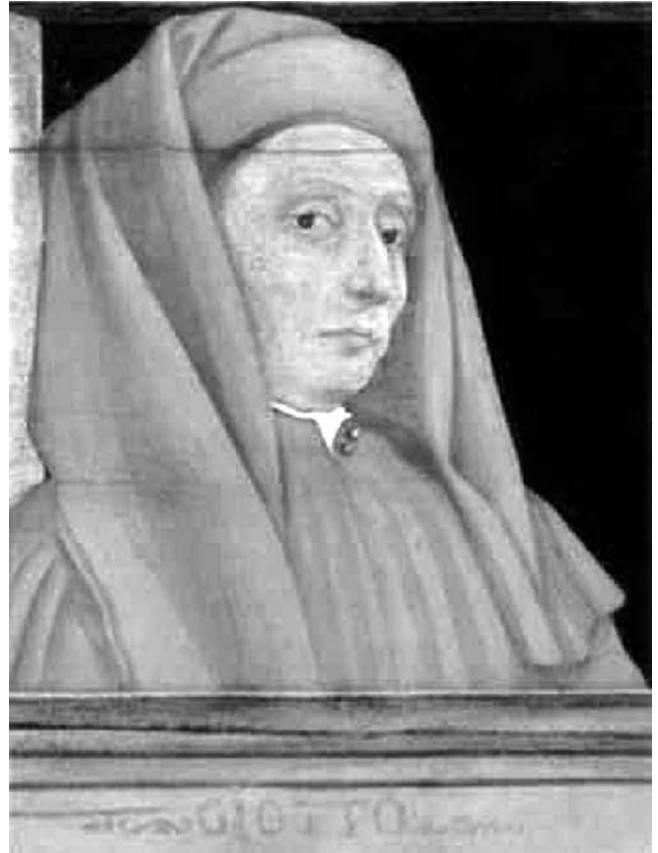
Paolo Ucello, Portret Giotta

On the eastern façade of the lighthouse constructed in 1871 at Jadrija near Šibenik, there is an in-built stone head – a life-size portrait. The author has attributed it to Juraj Dalmatinac, portrait sculptor from the early Renaissance period and author of the frieze consisting of 71 human heads at the Šibenik cathedral. This portrait belongs to the series of individualized portraits of the »common man« made by Juraj Dalmatinac. The portrait has been analysed and compared with his other psychological portraits, characterized by particular types of faces, hats, or hairstyles. In the mid-19 th century, 14 heads were substituted by new ones. On the southern apse, which bears 15 heads, the eighth head was substituted (counting from the left or from the south), which has now been associated with the portrait attributed to Juraj Dalmatinac.