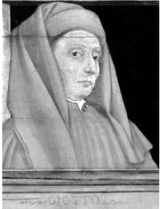
Paolo Ucello, Portret Giotta

On the eastern façade of the lighthouse constructed in 1871 at Jadrija near Šibenik, there is an in-built stone head – a life-size portrait. The author has attributed it to Juraj Dalmatinac, portrait sculptor from the early Renaissance period and author of the frieze consisting of 71 human heads at the Šibenik cathedral. This portrait belongs to the series of individualized portraits of the »common man« made by Juraj Dalmatinac. The portrait has been analysed and compared with his other psychological portraits, characterized by particular types of faces, hats, or hairstyles. In the mid-19 th century, 14 heads were substituted by new ones. On the southern apse, which bears 15 heads, the eighth head was substituted (counting from the left or from the south), which has now been associated with the portrait attributed to Juraj Dalmatinac.