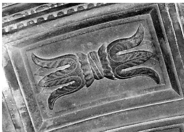
Kaseta na luku grobnice Sobota u crkvi Sv. Dominika u Trogiru