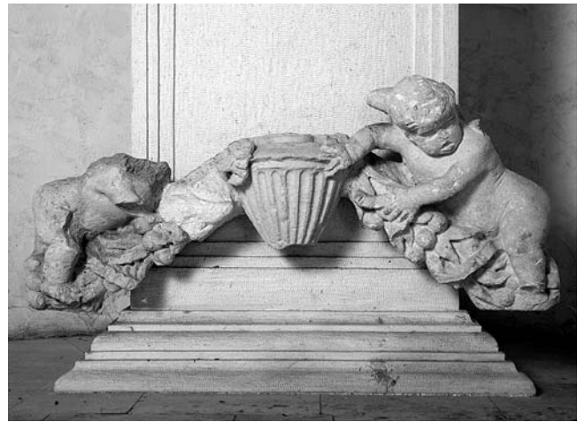
Anđeli na girlandi položeni naknadno na stepeništu novog postamenta za kip u crkvi Sv. Sebastijana u Trogiru