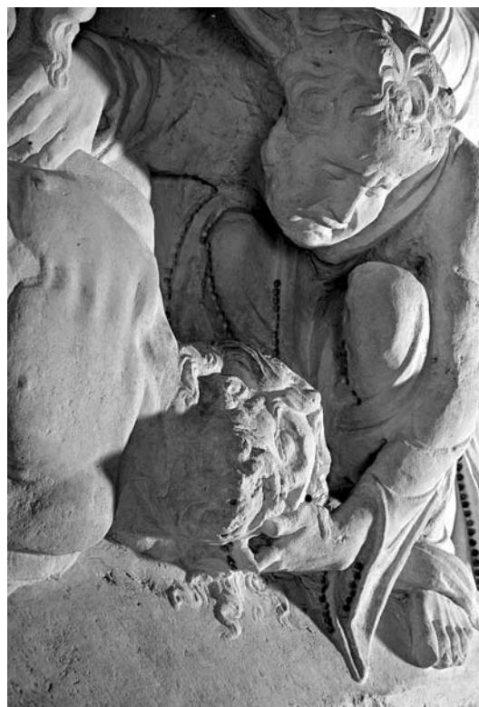
Detalj reljefa s prikazom Oplakivanja s glavom Krista (crkva Sv. Ivana Krstitelja u Trogiru)