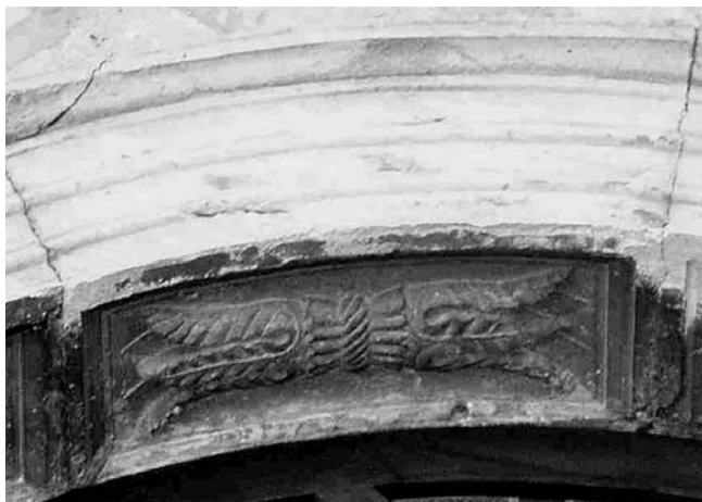
Kaseta na luku prozora na crkvi Sv. Nikole