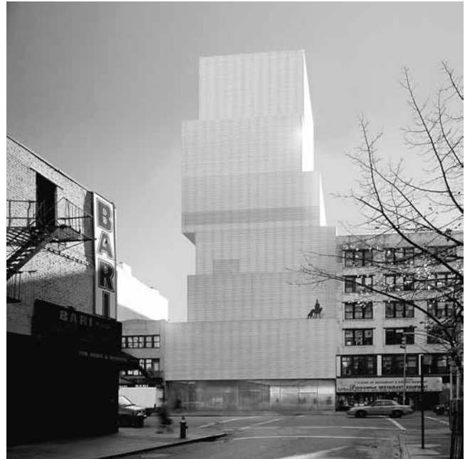
1. SANAA (Kazuyo Sejima, Ryue Nishizawa), Novi muzej suvremene umjetnosti/New Museum of Contemporary Art, Bowery, New York, maketa, 2004. – 2007.