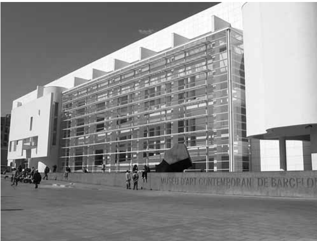
9. Richard Meier, Muzej suvremene umjetnosti, Barcelona, 1987. – 1995.