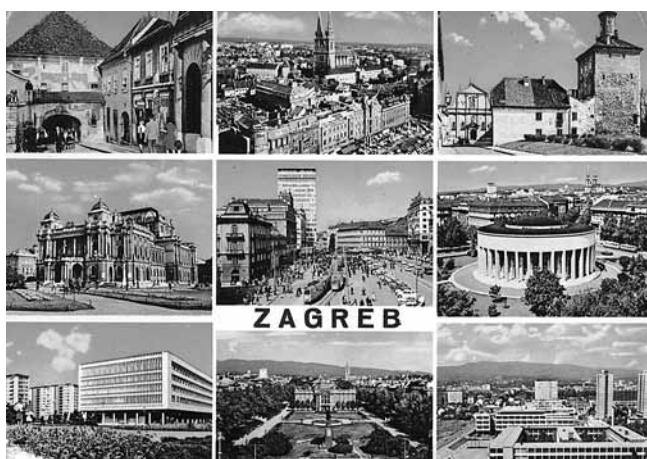
10. Razglednica s motivima Zagreba