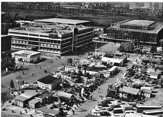
4. Razglednica s motivima Zagrebačkog velesajma: paviljon NjDR B. Rašice, 1964. i paviljon Mašinogradnje B. Rašice, 1957.