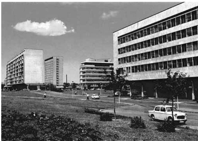
2. Razglednica s motivima Ulice proleterskih brigada, lijevo Galićeva zgrada (1956. – 1959.), desno Gradska skupština K. Ostrogovića (1955. – 1957.) (Hrvatski državni arhiv, Zagreb)