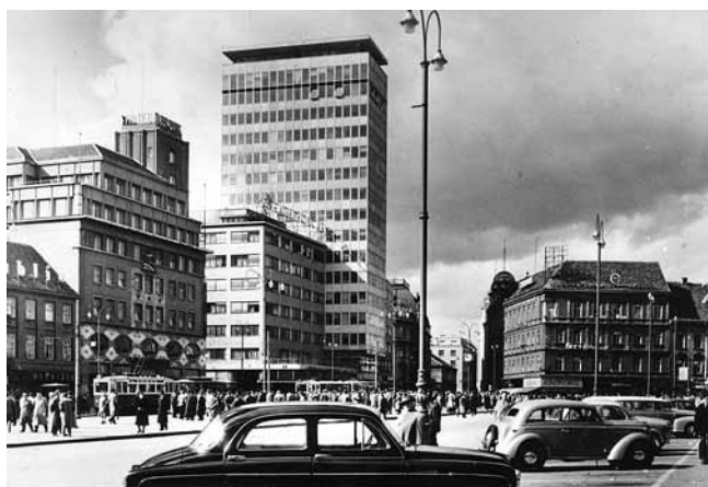
6. Razglednica s Iličkim neboderom (S. Jovičić, S. Hital, I. Žuljević, 1959.) (Hrvatski državni arhiv, Zagreb)