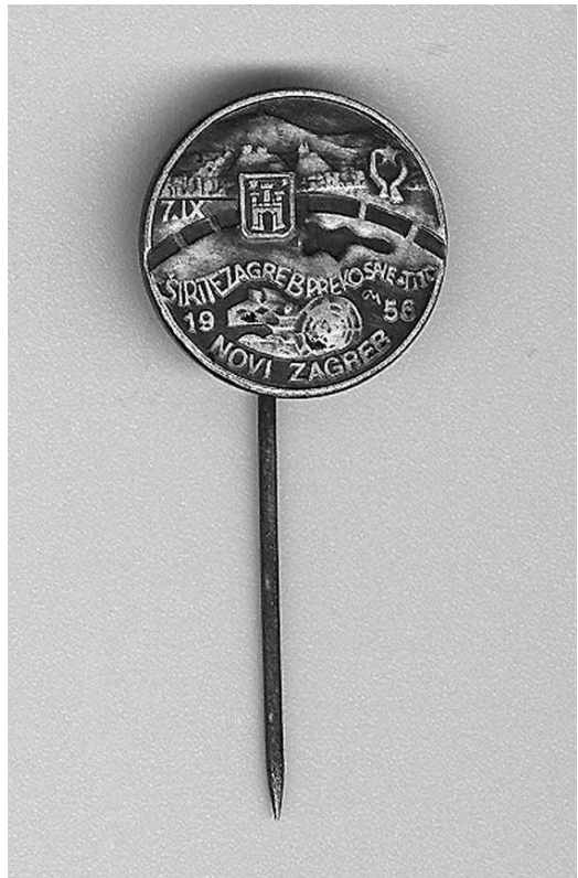
3. Značka s natpisom »Širite Zagreb preko Save«