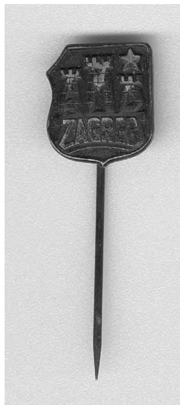
9. Značka s tradicionalnim grbom Zagreba s dodanom petokrakom zvijezdom