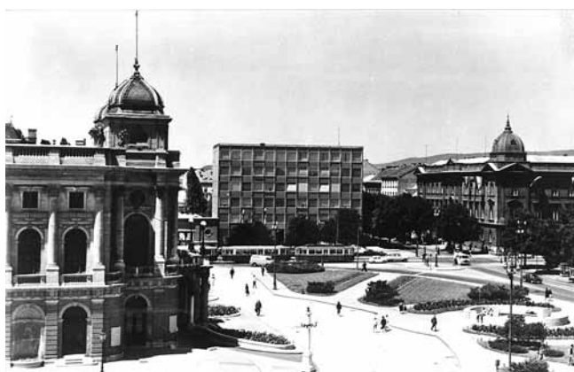
7. Razglednica s motivom zgrade Željpo (S. Fabris, 1964.) u sredini, HNK lijevo i zgradom Leksikografskog zavoda desno