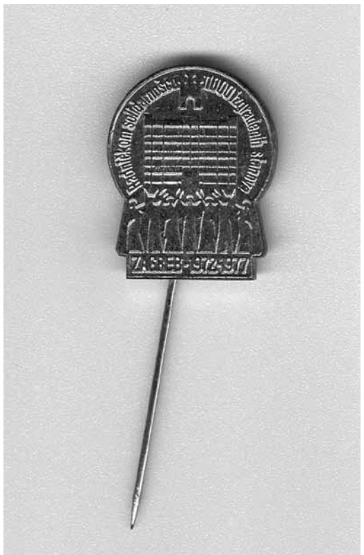
5. Značka s natpisom »Radničkom solidarnošću 1000 izgrađenih stanova«