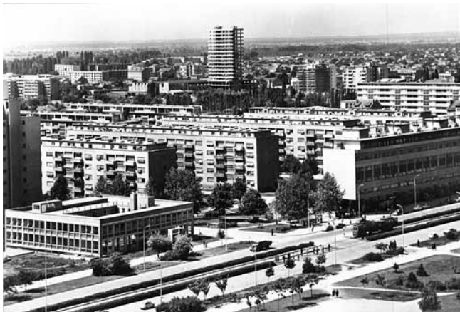
1. Razglednica s motivima Ulice proleterskih brigada, pogled na jugozapadni dio sa Šegvićevom zgradom (1947. – 1949.) desno i Vjesnikovim neboderom u izgradnji u pozadini (A. Ulrich, 1972.) (Hrvatski državni arhiv, Zagreb)