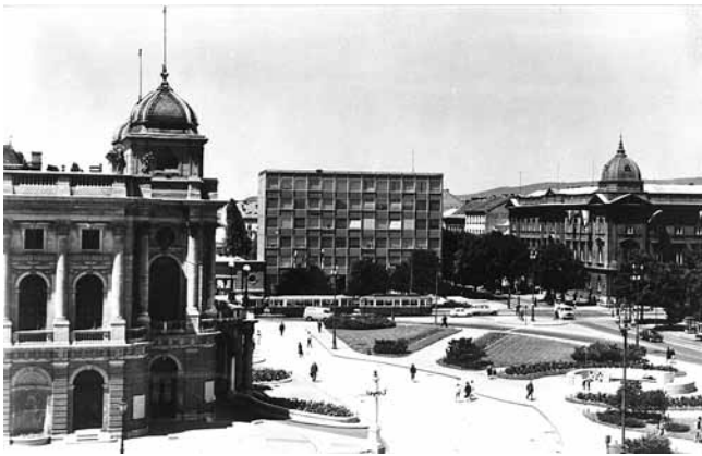
7. Razglednica s motivom zgrade Željpo (S. Fabris, 1964.) u sredini, HNK lijevo i zgradom Leksikografskog zavoda desno