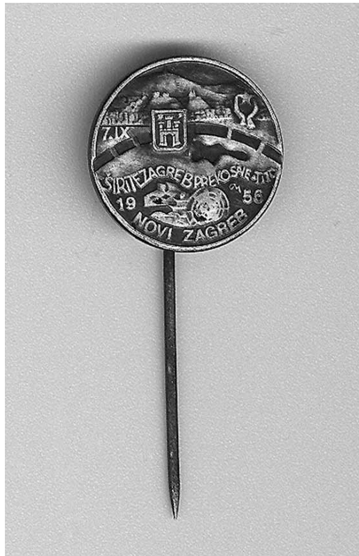
3. Značka s natpisom »Širite Zagreb preko Save«