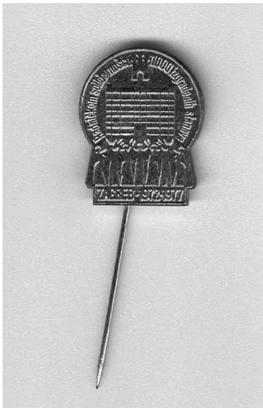
5. Značka s natpisom »Radničkom solidarnošću 1000 izgrađenih stanova«