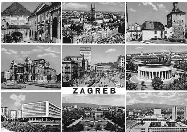
10. Razglednica s motivima Zagreba (Hrvatski državni arhiv, Zagreb)