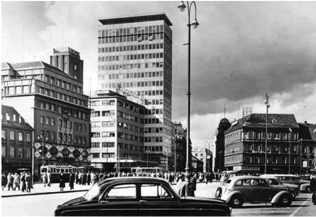
6. Razglednica s Iličkim neboderom (S. Jovičić, S. Hital, I. Žuljević, 1959.) (Hrvatski državni arhiv, Zagreb)