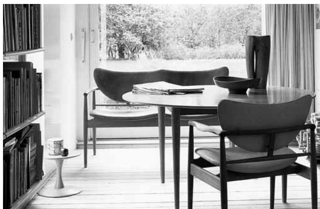
6. Dom danskog arhitekta i dizajnera F. Juhla s modelom naslonjača NV-48 u izvedbi mahagonij i svijetla koža, 1948. (M. Englund, C. Schmidt, Scandinavian Modern, London–New York, 2003.)