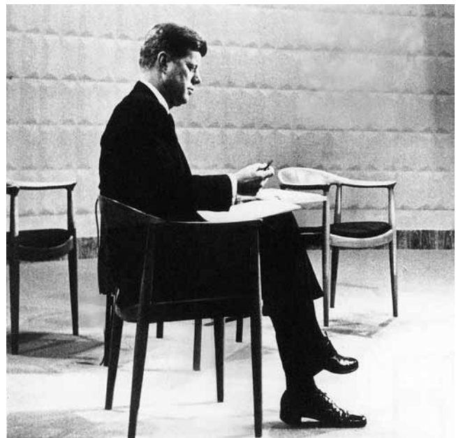
4. J. F. Kennedy u studiju CBS Television opremljenom Wegnerovim sjedalicama »Den runde stol« iz 1949.