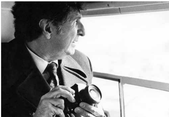
1. Bernardo Bernardi, arhitekt, dizajner i fotograf, 1921. – 1985.

Usp. Finska primjenjena umetnost, katalog izložbe, Beograd-Zagreb-Ljubljana, 1966.