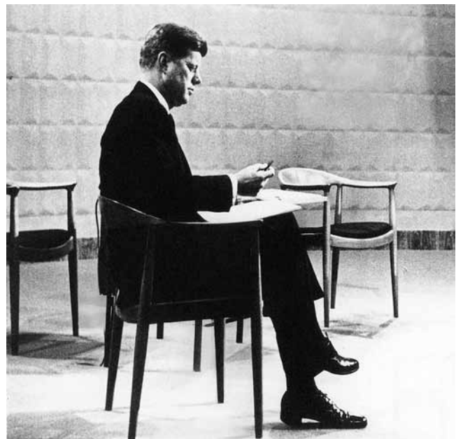
4. J. F. Kennedy u studiju CBS Television opremljenom Wegnerovim sjedalicama »Den runde stol« iz 1949.