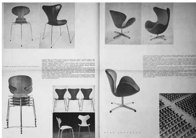
8. Bernardo Bernardi, Supremacija oblikovanja, Čovjek i prostor , 114, 1962.