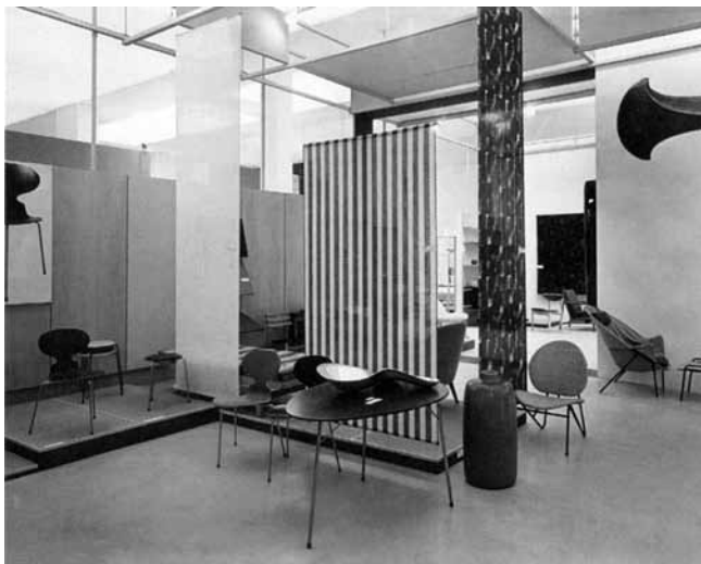
2. Danska izložba na 10. milanskom triennaleu, 1954. (Scandinavian Design Beyond the Myth. Fifty Years of Design from the Nordic Countries, Stockholm 2003.)