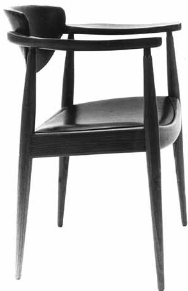
5. Bernardo Bernardi, polunaslonjač s rukonaslonom u proizvodnji Drvne industrije Vrbovsko, 1961.