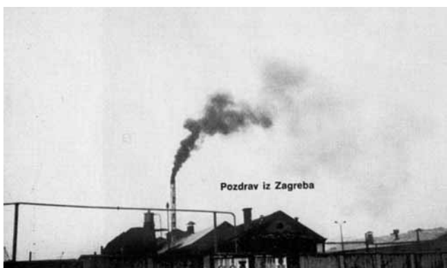
4. Grupa TOK, Pozdrav iz Zagreba , 1972. (Zbirka Marinko Sudac, Zagreb)