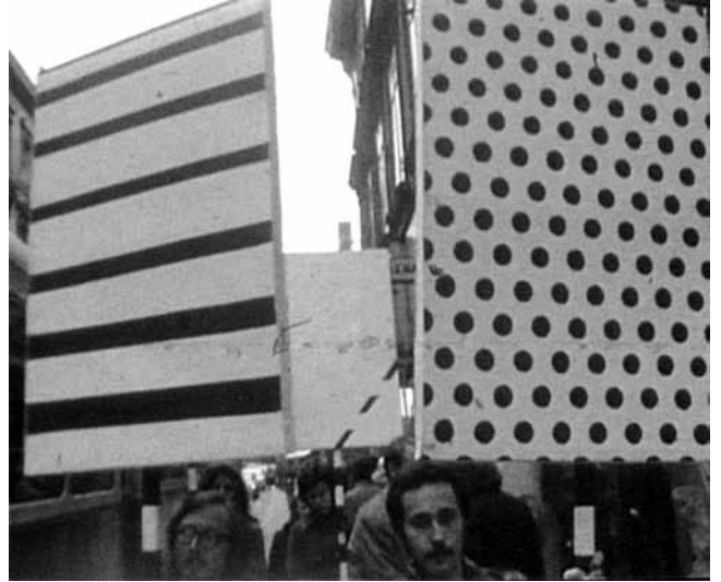
5. Grupa TOK, Demonstracija (Crte-Točke) , 1972. (Zbirka Marinko Sudac, Zagreb)