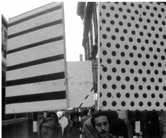
5. Grupa TOK, Demonstracija (Crte-Točke) , 1972. (Zbirka Marinko Sudac, Zagreb)