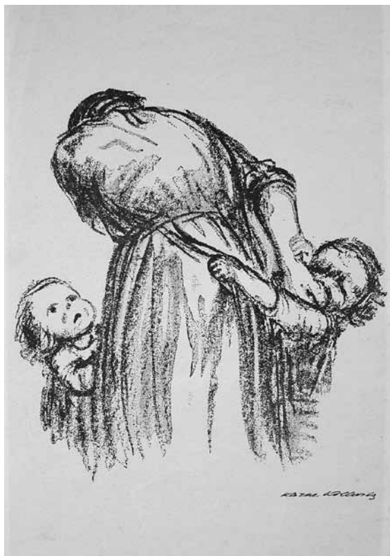
5. Käthe Kollwitz, Kruha! , 1924., litografija (Kabinet grafike HAZU, inv. br. KG HAZU 993)