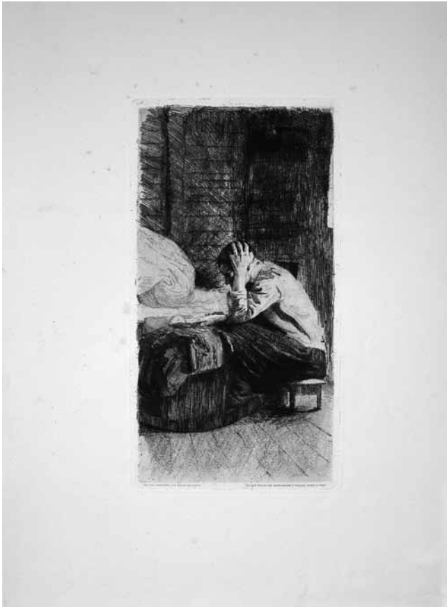
7. Käthe Kollwitz, Majka i dijete , bakropis (Kabinet grafike HAZU, inv. br. KG HAZU 6253)