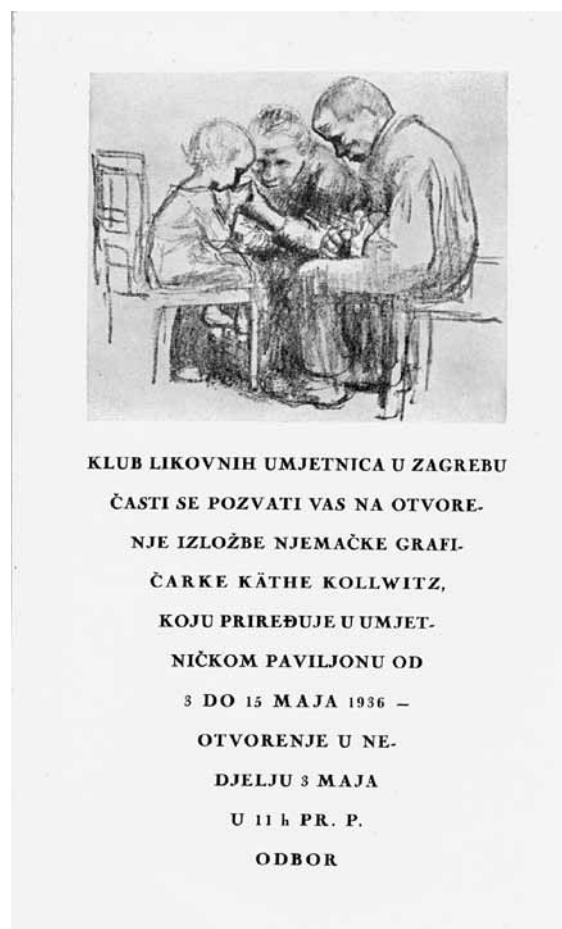
2. Pozivnica za otvorenje izložbe Käthe Kollwitz na kojoj je reproducirana grafika Posjet dječjoj bolnici , 1926.