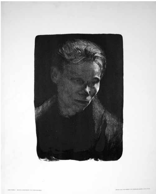
8. Käthe Kollwitz, Radnica (Žena s plavim šalom) , 1903., litografija (Kabinet grafike HAZU, inv. br. KG HAZU 6252)