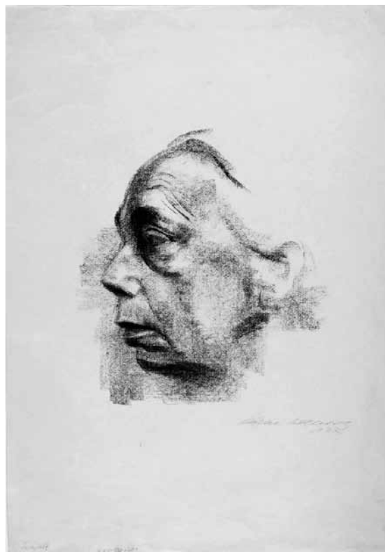
6. Käthe Kollwitz, Autoportret , 1927., litografija (Grafička zbirka NSK, inv. br. GZGS 558 k koll 1)