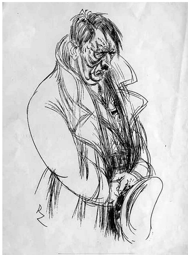
7. Richard Ziegler, Ljutiti Hitler, karikatura, tuš, papir, signirano: RZ