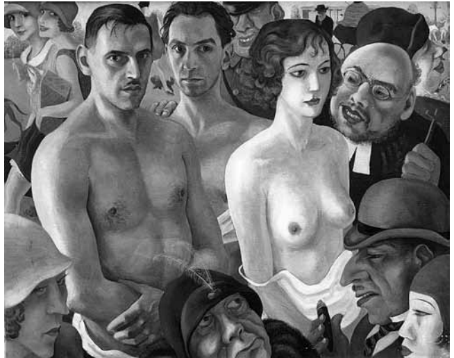
10. Richard Ziegler, Die Polizei , 1929., ulje na platnu, 80,5x100 cm, signirano i datirano