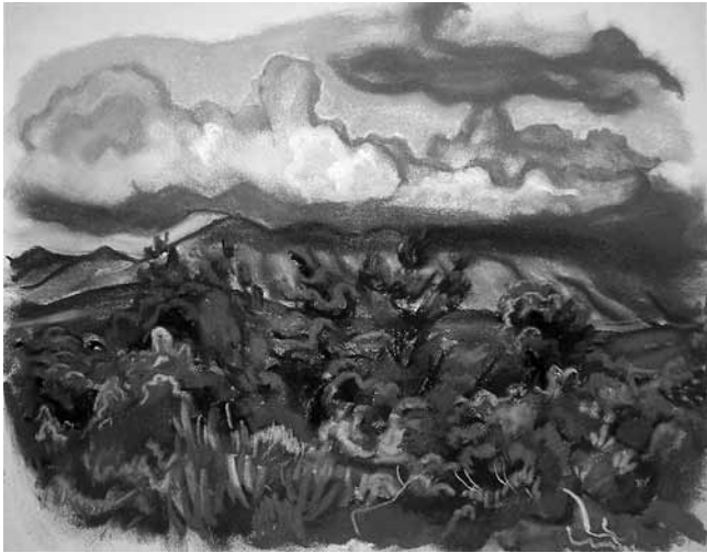
9. Richard Ziegler, Gelbe Wolke über bewegtem Land , pastel, 1933.