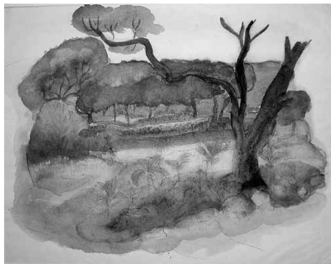
8. Edith Ziegler, Dunkler Stamm , akvarel, 1934., signirano: Et