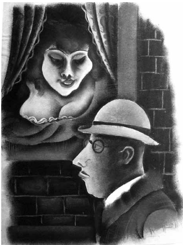
1. Richard Ziegler, Solide Schlafstelle für besseren Herrn , pastel, 1927./1928., 49,5x36,4 cm