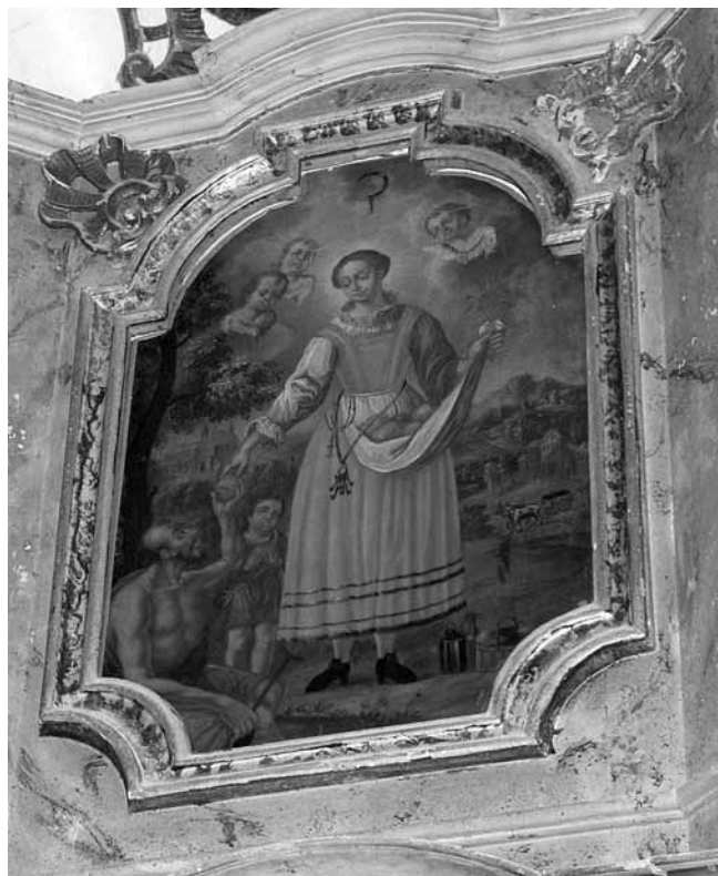
1. Donja Voća, kapela sv. Tome apostola, Sv. Notburga iz Rattenberga , Antonius Douetscher, 1774.