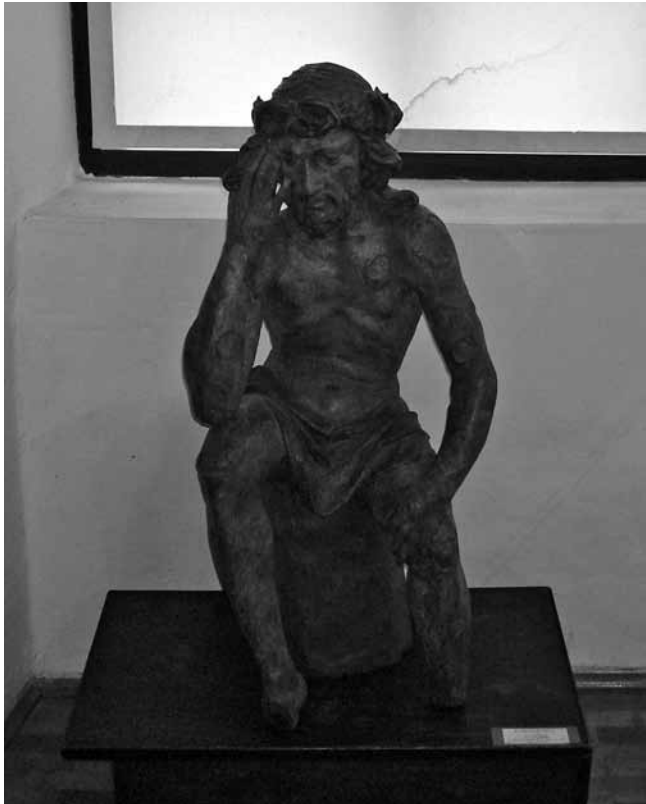
4. Križevci, Gradski muzej, Trpeći Krist ili Čovjek Boli (njem. Schmerzemann ), neznani kipar, oko 1700.