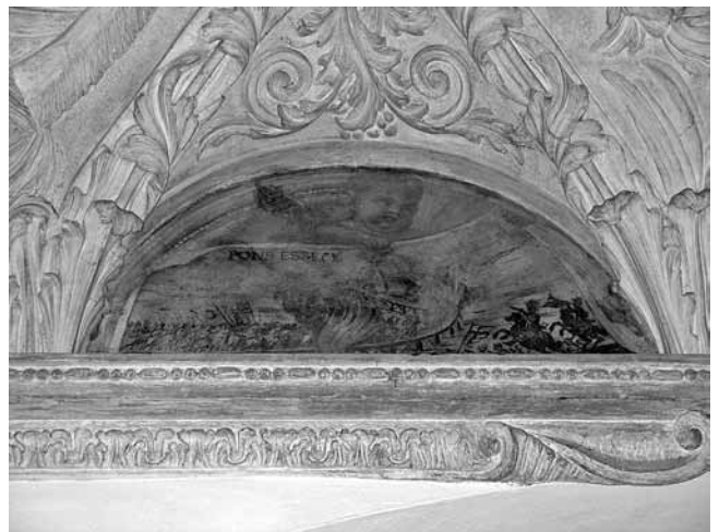
7. Trident, dvorac (del) Buonconsiglio, Sulejmanov most kraj Osijeka u plamenu , Giuseppe Alberti, 1688.