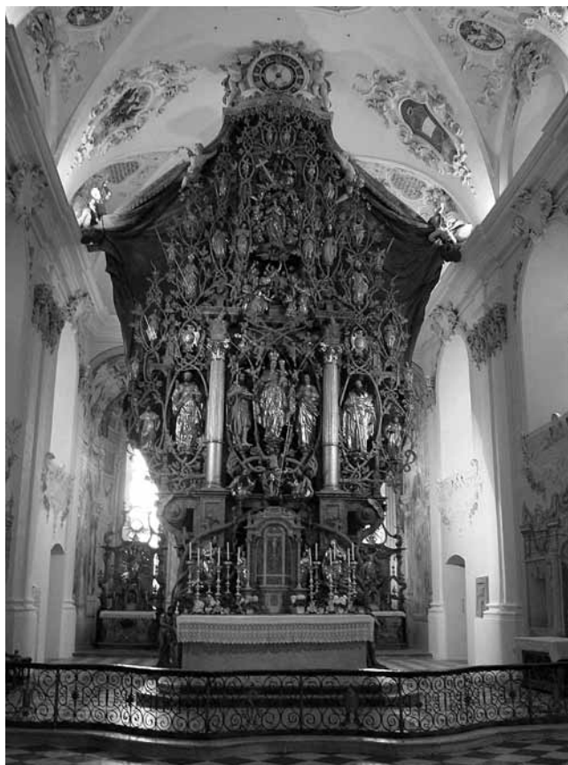
2. Stams kraj Innsbrucka, crkva cistercitskoga samostana, glavni oltar tipa Živo drvo (njem. Lebensbaum-Altar ); Bartholomäus Steinle, 1609. – 1613.

»(...) But at the same time, that very change and the adaptation to apparently new uses offers the best possible insight into the potential of the unique original and the variety of responses it is capable of arousing. (...)«; DAVID FREEDBERG, The Power of Images , Chicago–London, 1989., 121.