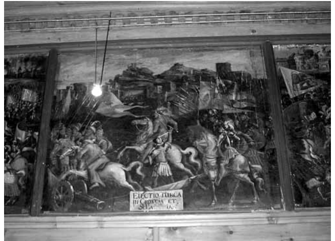
6. Innsbruck, dvorac Ambras, Progon Turaka iz Hrvatske i Slavonije , prije 1700. (?) (snimila S. Cvetnić)