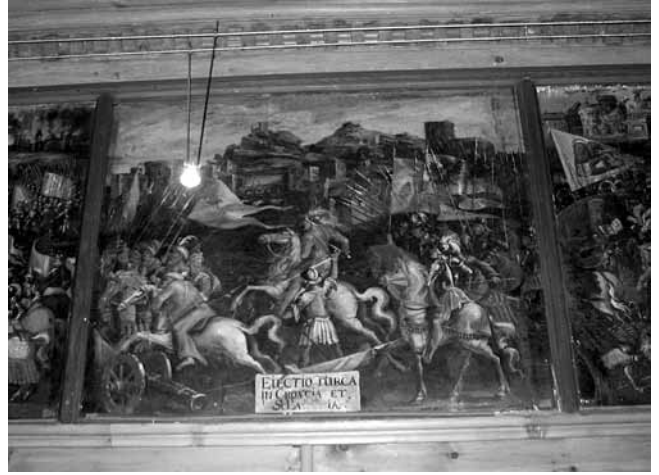
6. Innsbruck, dvorac Ambras, Progon Turaka iz Hrvatske i Slavonije , prije 1700. (?)