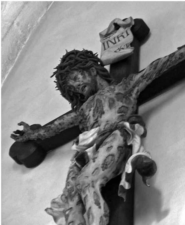
5. Kaltenbrunn kraj Landecka na Kaunertalu, Sjeverni Tiro, Raspeti – Kužnim križem (njem. Pestkreuz ), Andreas Thamasch, 1697.