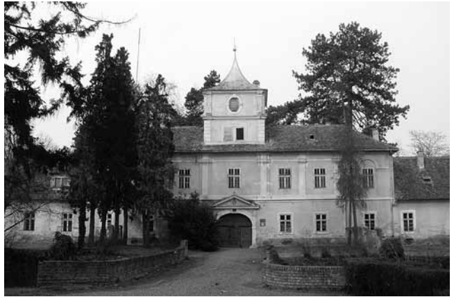
1. Dvorac Bilje, pročelje