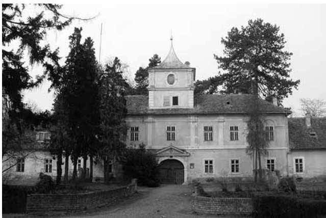
1. Dvorac Bilje, pročelje