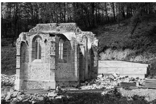
2. Zrin, crkva sv. Marije Magdalene, pogled sa sjeveroistoka nakon dovršetka radova u 2009. godini, nakon čega je prekinuto financiranje