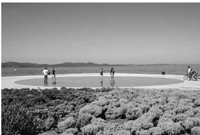
2. Nikola Bašić, Pozdrav Suncu , Zadar, 2008.