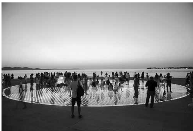
3. Nikola Bašić, Pozdrav Suncu , Zadar, 2008.